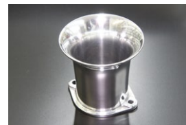
●44-48φ 75mm エアファンネル (ポリッシュ) ・適合 SOLEX44φ WEBER45φ/イタリー製48φ OER45/47φ ￥7,800 ・品番 F-4475P (内径48)