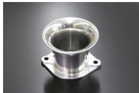
●40φ 50mm エアファンネル (STD) ・適合 SOLEX40φ WEBER40φ ￥4,500 ・品番 F-4050S (内径40)