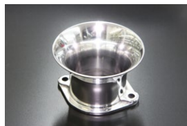
●44-48φ 50mm エアファンネル (ポリッシュ) ・適合 SOLEX44φ WEBER45φ/イタリー製48φ OER45/47φ ￥5,500 ・品番 F-4450P (内径48)