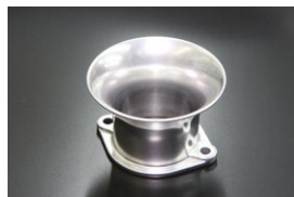
●44-48φ 50mm エアファンネル (STD) ・適合 SOLEX44φ WEBER45φ/イタリー製48φ OER45/47φ ￥4,500 ・品番 F-4450S (内径48)