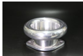
●44-48φ 45mm カールファンネル ・適合 SOLEX44φ WEBER45φ/イタリー製48φ OER45/47φ ￥5,000 ・品番 CF-4445 (内径48)