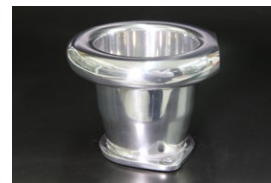
●44-48φ 75mm カールファンネル ・適合 SOLEX44φ WEBER45φ/イタリー製48φ OER45/47φ ￥8,000 ・品番 CF-4475 (内径48)