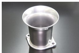
●44-48φ 75mm エアファンネル (STD) ・適合 SOLEX44φ WEBER45φ/イタリー製48φ OER45/47φ ￥6,300 ・品番 F-4475S (内径48)