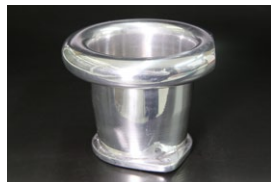
●WEBER 50φ 75mmカールファンネル ・適合 WEBER50φ WEBER48φ(スペイン製) ￥9,500 ・品番 CF-W5075 (内径55)