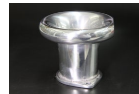
●44-48φ 80mm カールファンネル ・適合 SOLEX44φ WEBER45φ/イタリー製48φ OER45/47φ ￥8,000 ・品番 CF-4480 (内径48)