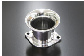
●40φ 50mm エアファンネル (ポリッシュ) ・適合 SOLEX40φ WEBER40φ ￥5,500 ・品番 F-4050P (内径40)