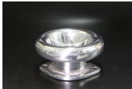
●40φ 45mm カールファンネル ・適合 SOLEX40φ WEBER40φ ￥4,500 ・品番 CF-4045 (内径40)