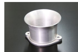
●SOLEX 50φ 50mmエアファンネル ￥8,000 ・品番 F-S5050 ※アルミ鋳造加工品 (ミクニ純正仕様: 内径53)