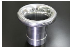
●ダンドラWEBER 48φ 75mmカールファンネル ・適合 WEBER 48 IDA ￥9,500 ・品番 CF-DW4875 (内径51)