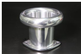
●44-48φ 70mm カールファンネル ・適合 SOLEX44φ WEBER45φ/イタリー製48φ OER45/47φ ￥5,500 ・品番 CF-4470 (内径48)