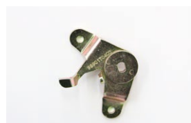
●WEBER50φ 左スロットルレバー ・ボールジョイント無し 本体 ¥4,300 ・ボールジョイント付き 本体 ¥5,000