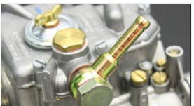
●WEBER フューエルパイプ ストレートパイプ 本体 ¥3,500