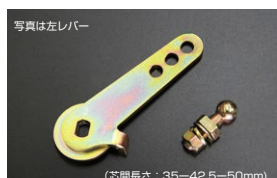
●WEBER40~45φ 調整式スロットルレバー (右レバー/左レバーあり) ・ボールジョイント無し 本体 ¥3,200 ・ボールジョイント付き 本体 ¥3,900