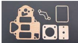
●OER/パッキンセット 45φ 本体 ¥1,900 47φ 本体 ¥1,900 50φ 本体 ¥1,900