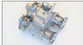
●OERキャブレター 45φ 本体 ¥52,000 47φ 本体 ¥56,000 50φ 本体 ¥98,000 (WEBERジェットタイプ) 45φ 本体 ¥55,000 (WEBERジェットタイプ) 47φ 本体 ¥59,000