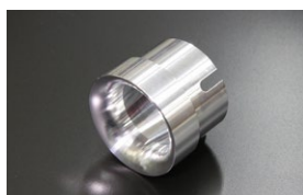
●WEBER 45φアウターベンチュリー (ジュラルミン製) ¥4,000 (32φ 34φ 36φ 38φ 40φ) ※DCOE9用とDCOE152用あり