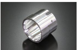
●WEBER 40φアウターベンチュリー (ジュラルミン製) ¥4,000 (32φ 34φ 36φ)