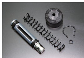
クラッチマスターリペアキット

品番: MK-N206 (5/8) 適合: S130, GC110前期 価格: ¥1,640 ※下側にボルトがあるタイプ