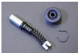
クラッチマスター シールキット

品番: N204 (G3625) (5/8) 適合: GC110後期, GC210, C130 価格: ¥2,400 ※下側にボルトがないタイプ