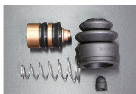
L型 クラッチリリースシールキット

品番: CK-4100 サイズ: 3/4 適合: S130, GC210, S30 価格: ¥1,140