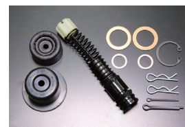
クラッチマスターリペアキット

品番: SX55005 サイズ: 5/8 (ナブコ用) 適合: SR311/SP311 価格: ¥4,000