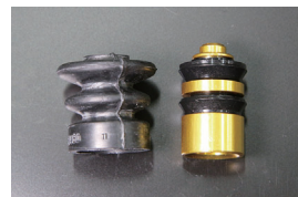
クラッチリリースリペアキット

品番: SX55016 サイズ: 3/4 適合: SR311/SP311 価格: ¥3,000