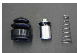
L型 クラッチリリースシールキット

品番: SX45004 サイズ: 3/4 (ブーツ内径8φ) 適合: TA22, TA27 (48.4~48.12) 価格: ¥5,000