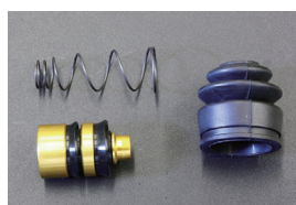
L型大容量クラッチリリースシールキット

品番: CK-4100W サイズ: 3/4 (ダブルシールタイプ) 適合: S130, GC210, S30等 価格: ¥2,500