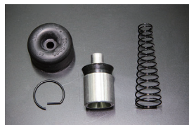
クラッチリリースリペアキット

品番: SX45003 サイズ: 5/8 適合: TA22, TA27 (45.12~50.9) 価格: ¥6,000