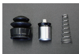
L型 クラッチリリースシールキット

品番: CK-4101 サイズ: 11/16 適合: S30, GC10, GC110 価格: ¥960