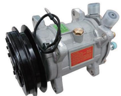
UP150-135B-ALIG16-12V-U04 国産旧車2000cc以上クラス ÿ70,000