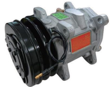
UP120-125AA-12V-DD 国産旧車小型車 2000cc以下サニー・レバンなど ÿ70,000