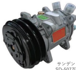
UP120-132AA-12V-U04 国産旧車小型車 2000cc以下サニー・レバンなど ÿ70,000