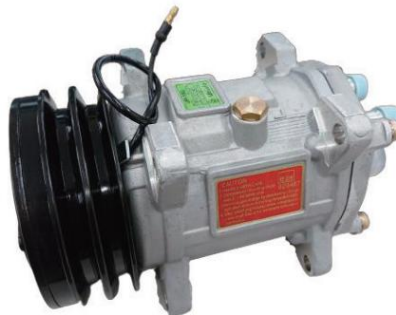
UP150-125AA-12V-DD 国産旧車2000cc以上クラス ÿ70,000