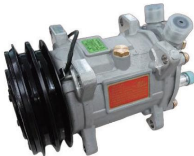
UP150-132AA-12V-U04 国産旧車2000cc以上クラス ÿ70,000