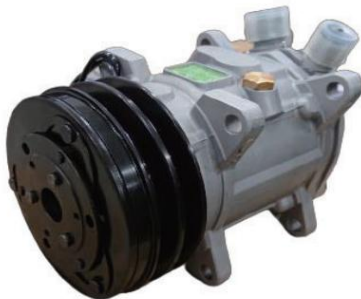
UP120-125AA-12V-U04 国産旧車小型車 2000cc以下サニー・レバンなど ÿ70,000