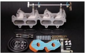
1042 (ピロリングージ式) 4AG/MR2 (AW11) ¥37,000 生産中止