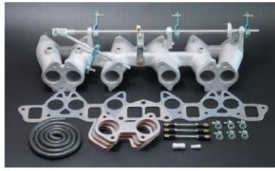
1002W-T (テフロンプッシュタイプ) L型6気筒車 (50φキャブ用) ワイヤー式 ¥68,000 ※インマニガasketとフェューエルホースは別売りです。