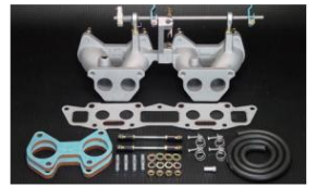
1011 (ピロリングージ式) A12,A14,A15 丸ポート シングルキャブ仕様車 ¥54,000円 ※インマニガasketとフェューエルホースは別売りです。