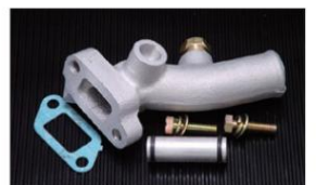
4AG ウォーターアウトレット #1046インマニ及び純正インマニ使用可能。 ¥15,000 生産中止