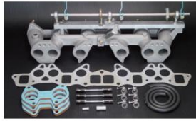
1001W-T (テフロンプッシュタイプ) L型6気筒車 (44φキャブ用) ワイヤー式 ¥65,000 ※インマニガasketとフェューエルホースは別売りです。