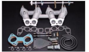
1018 (ピロリングージ式) 4K,5K型 全車 ¥52,000 ※インマニガasketとフェューエルホースは別売りです。