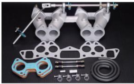
1017 (ピロリングージ式) L型4気筒車 ¥55,000 ※インマニガasketとフェューエルホースは別売りです。