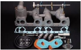
1019 (ピロリングージ式) Z型エンジン (Z16,Z18,Z20) ¥62,000円 ※インマニガasketとフェューエルホースは別売りです。