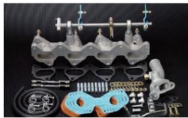
1046 (ピロリングージ式) 4AG/AE86 140馬力ヘッド専用 ¥53,000 生産中止 ※インマニガasketとフェューエルホースは別売りです。