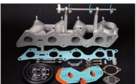
1034 (ピロリングージ式) G54B/ジブ2600 (J57) ¥60,000円 ※インマニガasketとフェューエルホースは別売りです。