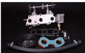
1041 (ピロリングージ式) マイテイボーイ アルト3気筒-F5A OHC ¥58,000 ※インマニガasketとフェューエルホースは別売りです。