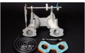
mini (ピロリングージ式) ミニクパー タコ足装飾車のみ可 ¥50,000円 ※インマニガasketとフェューエルホースは別売りです。