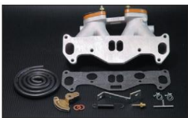
1014 13B AP車 ¥46,000 ※インマニガasketとフェューエルホースは別売りです。