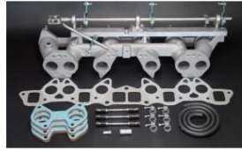
1001PW (ピロリングージ式) L型6気筒車 (44φキャブ用) 販売中止