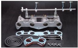
1030R 2TG ピロリングージ+インマニSET ロッド式 ¥65,000 (リングージ ¥27,000/インマニ ¥38,000) ※インマニガasketとフェューエルホースは別売りです。