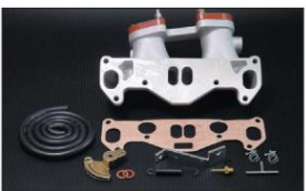
1015-2 12A AP車 (6P除く) ¥46,000 ※インマニガasketとフェューエルホースは別売りです。