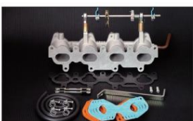
1043 (ピロリングージ式) NA6C/E1600cc ユーノスロードスター ¥60,000円 ※インマニガasketとフェューエルホースは別売りです。