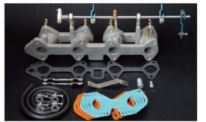
1009 (ピロリングージ式) 13T系はデストリビューター交換要 ¥52,000 ※インマニガasketとフェューエルホースは別売りです。