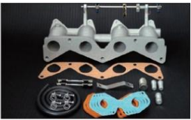
1028 (ピロリングージ式) FJ20 ¥53,000 ※インマニガasketとフェューエルホースは別売りです。