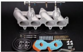
1033 (ピロリングージ式) 4AG/AE86 ¥46,000 生産中止 ※インマニガasketとフェューエルホースは別売りです。