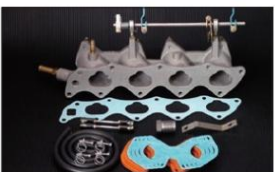
1037 (ピロリングージ式) セック ワンダーシビック/CR-X ¥46,000 生産中止