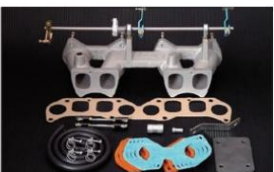
1007 (ピロリングージ式) ペレット/117 (DOHC除く) ターンローカー専用 ¥38,000 生産中止 ※インマニガasketとフェューエルホースは別売りです。