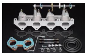
1045 (ピロリングージ式) NA8C/E1800cc ユーノスロードスター ¥60,000円 ※インマニガasketとフェューエルホースは別売りです。