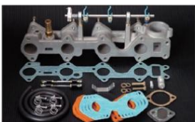
1004 (ピロリングージ式) 4G52/アストロン (2000cc) G52B 4G53 (2400cc)はマニガasket ¥60,000円 ※インマニガasketとフェューエルホースは別売りです。