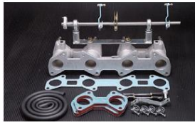
1031W 18RG ピロリングージ+インマニSET ワイヤー式 ¥65,000 (リングージ ¥27,000/インマニ ¥38,000) ※インマニガasketとフェューエルホースは別売りです。