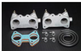
1030 (ピロリングージ式) いすゞ DOHC PF60 DOHC ミニク 加工する ¥38,000 ※インマニガasketとフェューエルホースは別売りです。