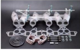
1002R-T (テフロンプッシュタイプ) L型6気筒車 (50φキャブ用) ロッド式 ¥71,000 ※インマニガasketとフェューエルホースは別売りです。