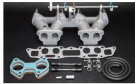
1006 (ピロリングージ式) A12-A14,A15 楕円ポート ツインキャブ仕様車 (FF車除く) ¥54,000 ※インマニ ガasketとフェューエルホースは別売りです。