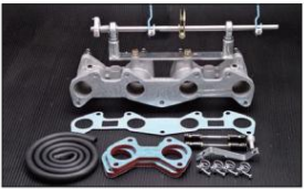
1030W 2TG ピロリングージ+インマニSET ワイヤー式 ¥65,000 (リングージ ¥27,000/インマニ ¥38,000) ※インマニガasketとフェューエルホースは別売りです。