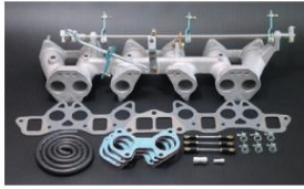
1001R-T (テフロンプッシュタイプ) L型6気筒車 (44φキャブ用) ロッド式 ¥68,000 ※インマニガasketとフェューエルホースは別売りです。