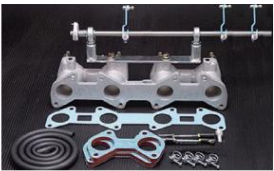
1031R 18RG ピロリングージ+インマニSET ロッド式 ¥65,000 (リングージ ¥27,000/インマニ ¥38,000) ※インマニガasketとフェューエルホースは別売りです。