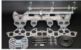
1002PW (ピロリングージ式) L型6気筒車 (50φキャブ用) 販売中止