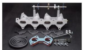
1045-2 (ピロリングージ式) NB8C/E1800cc ユーノスロードスター ¥60,000円 ※インマニガasketとフェューエルホースは別売りです。