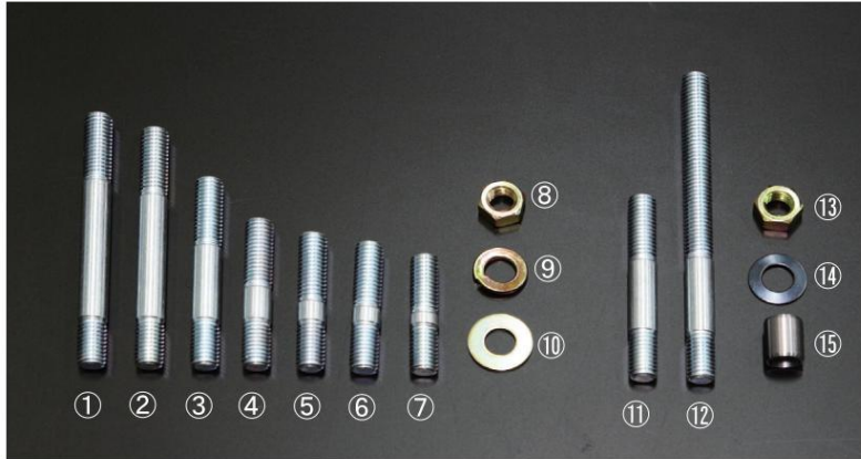
γ KAMEARI stud bolt details