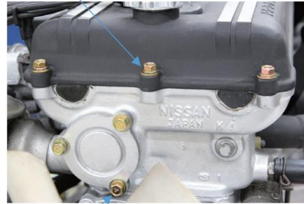
γ Discby gear cover bolt set of 3 γMark bolt