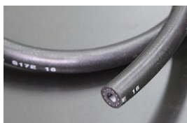
内径6mm フューエルゴムホース (キャブ車用) 本体 ¥1,000/1m