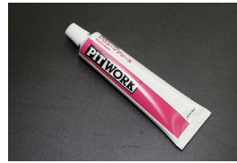
日産 シリコングリース オイルシリンダーキャップゴム等の シールや潤滑などに使用 価格：¥3,000