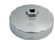
カップ型オイルフィルターレンチ 品番：AVSA-092 適合：L20~L28, FJ20 価格：¥3,210 ※フィルター直径 93φ