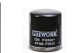
オイルフィルター 品番：AY100-TY014 適合：4AG, 3SG 価格：¥1,000