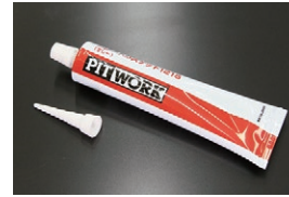
日産 シールパッキン グレー エンジン、ミッション、デフの組み立て用 に使用できる液体ガスケット。 塗布後約30分ぐらいで固まりはじめる 価格：¥3,200