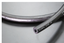
内径9mm フューエルゴムホース (キャブ車用) 本体 ¥1,400/1m