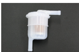
汎用フューエルフィルター 品番：AY505-NS014 適合：8mm ホース、キャブ車専用 価格：¥1,690