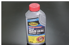
リスロン 超強力オイル漏れ修理剤 メインシャフトシールリベア ※クラックシールからのオイル漏れを 高い確率で治せるゴムシール専用修理剤 価格：¥3,080