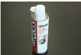
日産純正パーツクリーナー (480ml) ¥1,300 エンジンパーツやブレーキ回りの洗浄に最適。 速乾タイプなのでパーツに水滴が付きづらい。