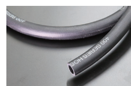
内径11.5mm フューエルゴムホース (キャブ車用) 本体 ¥2,400/1m 本体 ¥1,200/0.5m