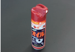
オイルスプレー (220ml) ¥800 カム、クラック、コンロッド、 シリンダーなどの保管時の錆止めに便利な スプレー式オイル。