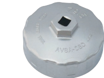
カップ型オイルフィルターレンチ 品番：AVSA-080 適合：A12~A15, U20, H20 価格：¥2,890 ※フィルター直径 80.5φ