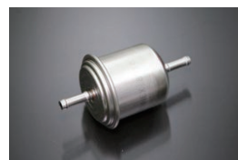
DR30インジェクション フューエルフィルター (φ56) 品番：16400-0W010 適合：FJ20インジェクション車 価格：¥6,070