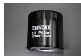
オイルフィルター 品番：AY100-TY023 適合：2TG, 3TG, 2T, 3T 価格：¥1,400