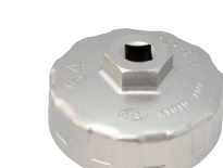
カップ型オイルフィルターレンチ 品番：AVSA-064 適合：3K, 4K, 4AG, 3SG 価格：¥2,680 ※フィルター直径 65φ