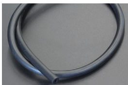
4mm バキュームホース ¥1,300/1m プースト計やディスプレイのバキューム等に 使用できる。