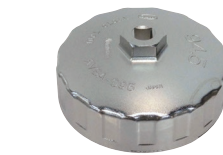
カップ型オイルフィルターレンチ 品番：AVSA-095 適合：2TG, 3TG, 2T, 3T 価格：¥3,210 ※フィルター直径 95.5φ