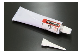
日産 シールパッキン ブラック エンジンの組み立て用に使用できる液体 ガスケットで乾燥後は耐熱、耐油に優れた ゴム状の弾性被膜を形成する 価格：¥3,100