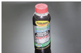
リスロン 超強力水漏れ修理剤 ラジエーター&ヒーターコアストップリーク ※ラジエーターやヒーターコアからの水漏 れを高い確率で永久的に治せる修理剤 価格：¥3,120