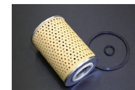
オイルフィルター 品番：15208-78525 適合：S20, G7 価格：¥5,330 (2025.1.1更新)