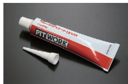
日産 シールパッキン ベンガラ エンジン、ミッション、デフの組み立て用 に使用できる液体ガスケット。 塗布後約5分ぐらいで固まりはじめる 価格：¥2,900