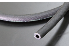
内径8mm フューエルゴムホース (高圧対応/インジェクション車用) 本体 ¥1,500/1m