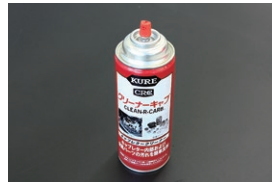
キャブクリーナー (420ml) ¥1,200 ソレックスやウエーパーの内部や外観 の頑固な油汚れを簡単に落とせる強力 クリーナー