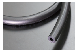
内径8mm フューエルゴムホース (キャブ車用) 本体 ¥1,000/1m