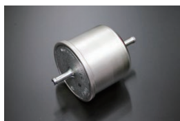
GC210/S130インジェクション フューエルフィルター (φ73) 品番：16400-Q0805 適合：L型インジェクション車 価格：¥7,940