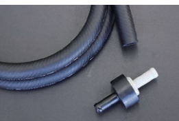
マスターパックホース&チェックバルブ 汎用チェックバルブ ¥3,910 汎用マスターパックホース ¥4,610 (内径9mm×1.5M)