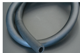
12φ 耐圧耐油ゴムホース オイルクーラー等の高圧力に対応する 耐油性ゴムホース ¥1,500/1m