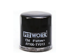
オイルフィルター 品番：AY100-TY013 適合：3K, 4K, 5K 価格：¥1,050