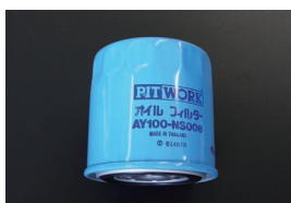
オイルフィルター 品番：AY100-NS008 適合：L20~L28 L14~L18 Z18, Z20, FJ20 価格：¥1,450