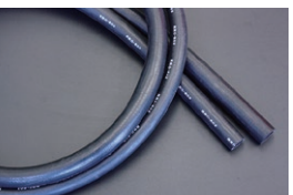
汎用ヒーターホース (肉厚 4mm 長さ 1m) ・内径 16φヒーターホース ¥1,700 ・内径 19φヒーターホース ¥2,000