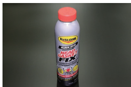
リスロン 超強力水漏れ修理剤 ヘッドガスケットフィックス ※ヘッドガスケットからの水漏れを 高い確率で永久的に治せる修理剤 価格：¥11,670