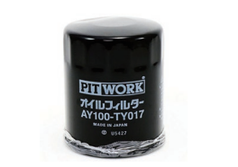
オイルフィルター 品番：AY100-TY017 適合：18RG 価格：¥1,260