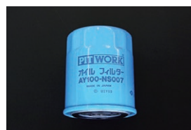
オイルフィルター 品番：AY100-NS007 適合：A12~A15, U20, H20 価格：¥1,150