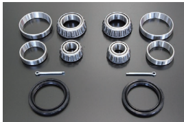
フロントハブベアリング オーバーホールキット 適合：GC10/GC110/GC210 S30/S130 (2026.4.15 更新) 価格：¥13,600/左右セット