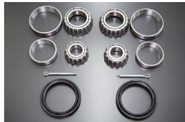
フロントハブベアリング オーバーホールキット 適合：510 (2026.4.15 更新) 価格：¥10,160/左右セット