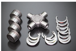
プロペラシャフトスパイダーSET 適合：S30, S130, GC10, GC110 GC210, KHC130他 価格：¥6,520/1ヶ (2026.4.15 更新)