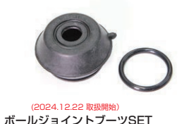
ボールジョイントブーツSET (2024.12.22 取扱開始) 適合：S30後期/S10後期 (スピンドルサイズ：M14) 価格：¥600/1個セット ※単品：ブーツ ¥350 バンド ¥250