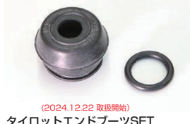
タイロッドエンドブーツSET (2024.12.22 取扱開始) 適合：S30/S31/S10 価格：¥900/1個セット ※単品：ブーツ ¥650 バンド ¥250