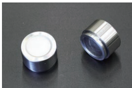
MK63用 キャリパーピストン 適合：MK63 (NISMO, プレジデント) 価格：¥2,360/1ヶ (2026.4.15 更新)