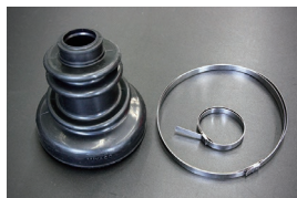
等速ドライブシャフトブーツ (外側) 品番：39741-04F25 適合：S130, R30 (ターボ車) 価格：¥4,930/1ヶ (2025.4.13 更新)