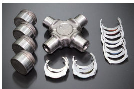
ドライブシャフトスパイダーSET 適合：S30, S130, GC10, GC110 GC210, KHC130他 価格：¥9,130/1ヶ (2026.4.15 更新)