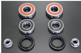
リヤハブベアリング (2026.4.15 更新) オーバーホールキット 適合：GC10/GC110/GC210 S130 価格：¥8,440/左右セット