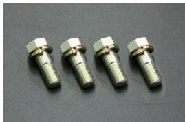
MK63 キャリパー取り付けボルト ¥2,200/4本 SET (2025.4.13 更新)