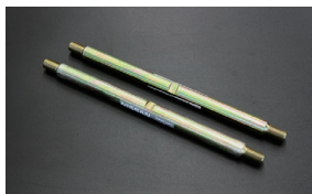
S30 リアロアームスピンドル (2026.4.15 更新) ¥2,660/1本 ・ロアームブッシュの交換時に 固着したスピンドルを交換 ※別売り ロックボルト ¥3,920/1本