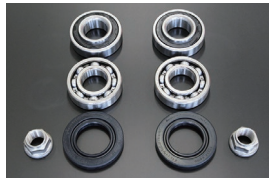
リヤハブベアリング (2026.4.15 更新) オーバーホールキット 適合：S30/S31 価格：¥22,240/左右セット