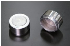
純正キャリパーピストン 適合：S30, GC10, GC110, 230 KHC130 価格：¥8,190/1ヶ (2026.4.15 更新)