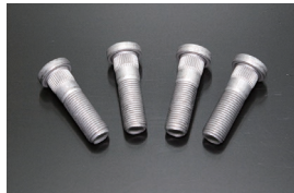
5mmロングハブボルト サイズ：首下42mm ネジ長27mm 適合：日産旧車用 価格：¥300/1本 (2026.4.15 更新)