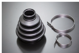
ドライブシャフトブーツSET 適合：S30, S130, GC10, GC110 GC210, KHC130他 価格：¥2,260/1ヶ ※バンド付き片側セット (2026.4.15 更新)