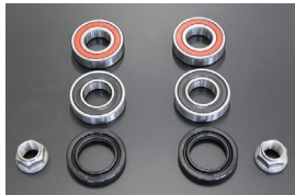
リヤハブベアリング (2026.4.15 更新) オーバーホールキット 適合：510 価格：¥6,340/左右セット