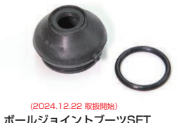
ボールジョイントブーツSET (2024.12.22 取扱開始) 適合：S30前期/S10前期 (スピンドルサイズ：M12) 価格：¥570/1個セット ※単品：ブーツ ¥320 バンド ¥250