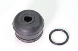
ボールジョイントブーツSET (2024.12.22 取扱開始) 適合：230/330 価格：¥1,020/1個セット ※単品：ブーツ ¥800 バンド ¥220

リヤライニング スパイダー ドライブシャフトパーツ ローター キャリパー ハブベアリング