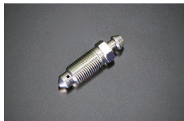
純正キャリパーニップル 適合：S30, GC10, GC110, 230 KHC130 価格：¥490/1ヶ (2026.4.15 更新)