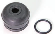
ボールジョイントブーツSET (2024.12.22 取扱開始) 適合：230/330 価格：¥1,020/1個セット ※単品：ブーツ¥800 バンド¥220

リヤライニング スパイダー ドライブシャフトボルト ローター キャリパー ハブベアリング