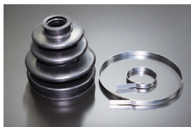
等速ドライブシャフトブーツ (内側) 品番：39740-04F25 相当品 適合：S130, R30 (ターボ車) 価格：¥2,200/1ヶ ※ハウジングを分解せずに交換するタイプ