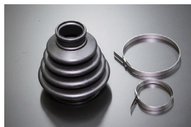
ドライブシャフトブーツSET 適合：S30,S130,GC10,GC110 GC210,KHC130他 価格：¥2,150/1ヶ ※バンド付片側セット