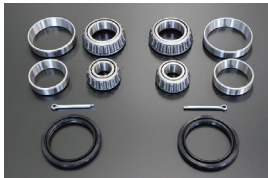
フロントハブベアリング オーバーホールキット 適合：GC10/GC110/GC210 S30/S130 価格：¥13,580/左右セット