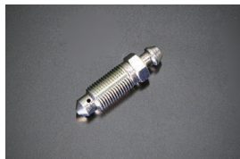
純正キャリパーニップル 適合：S30,GC10,GC110,230 KHC130 価格：¥470/1ヶ