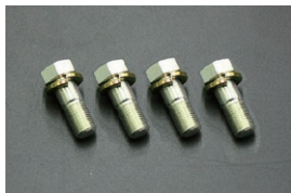
MK63 キャリパー取り付けボルト ¥1,600/4本SET