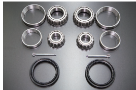
フロントハブベアリング オーバーホールキット 適合：510 価格：¥10,140/左右セット