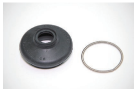
タイロッドエンドブーツSET 適合：GC10 価格：¥740/1個セット ※単品：ブーツ¥400 バンド¥340