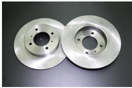
STDブレーキローターセット ・GC10 (F)：¥45,000/セット ・GC110 (F)：¥45,000/セット ・S130前期 (R)：¥45,000/セット ・S130後期 (R)：¥26,800/セット