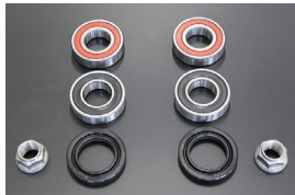
リヤハブベアリング オーバーホールキット 適合：510 価格：¥6,300/左右セット