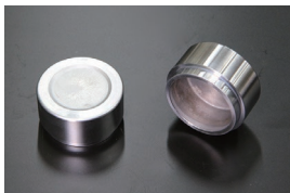
純正キャリパーピストン 適合：S30,GC10,GC110,230 KHC130 価格：¥7,830/1ヶ