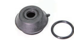
ボールジョイントブーツSET (2024.12.22 取扱開始) 適合：S30後期/S10後期 (スピンドルサイズ：M14) 価格：¥600/1個セット ※単品：ブーツ¥350 バンド¥250