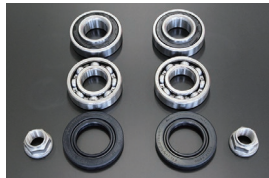
リヤハブベアリング オーバーホールキット 適合：S30/S31 価格：¥22,200/左右セット