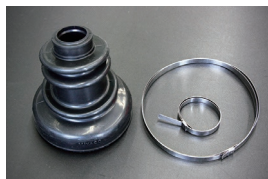
等速ドライブシャフトブーツ (外側) 品番：39741-04F25 適合：S130, R30 (ターボ車) 価格：¥4,860/1ヶ