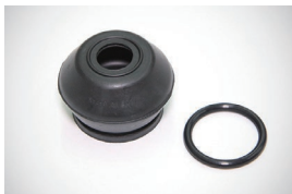
ボールジョイントブーツSET 適合：GC10 価格：¥760/1個セット ※単品：ブーツ¥540 バンド¥220