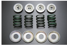
リヤライニング取付キット 適合：GC10, GC110, 510 価格：¥1,720/左右セット