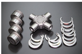
プロペラシャフトスパイダーSET 適合：S30,S130,GC10,GC110 GC210,KHC130他 価格：¥6,240/1ヶ