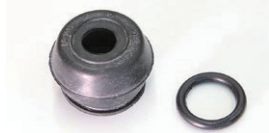
タイロッドエンドブーツSET (2024.12.22 取扱開始) 適合：S30/S31/510 価格：¥900/1個セット ※単品：ブーツ¥650 バンド¥250