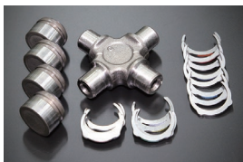
ドライブシャフトスパイダーSET 適合：S30,S130,GC10,GC110 GC210,KHC130他 価格：¥8,730/1ヶ