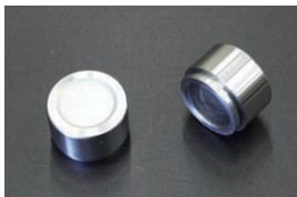
MK63用 キャリパーピストン 適合：MK63 (NISMO, プレジデント) 価格：¥2,260/1ヶ