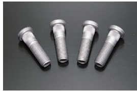
5mmロングハブボルト サイズ：首下42mm ネジ長27mm 適合：日産旧車用 価格：¥290/1本