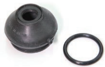
ボールジョイントブーツSET (2024.12.22 取扱開始) 適合：S30前期/S10前期 (スピンドルサイズ：M12) 価格：¥570/1個セット ※単品：ブーツ¥320 バンド¥250