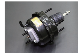
GC110 前期マスターバック サイズ: 外径143φ (ツマ部) ※スペーサー使用でハコスカ流用可 価格: ¥80,300 (2026.4.10更新) ※在庫限り