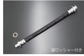
S30, S31, PS30 純正クラッチホース ・全長: 230mm (ねじ部込み) ・適合: S30, S31, PS30 ・価格: ¥3,270 (2026.4.9更新)