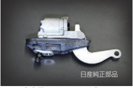
7/8大容量ホイルシリンダー 適合: GC10, GC110, 510 価格: ¥49,100/1ヶ (更新 2026.05.07)