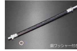
SR311/SP311 純正クラッチホース ・全長: 275mm (ねじ部込み) ・適合: SR311/SP311全車 ・価格: ¥4,210 (2026.4.9更新)