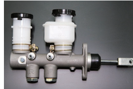
SR311 ブレーキマスターシリンダー サイズ: 3/4 適合: SR311, SP311 (67.5~70年) 価格: ¥59,000 ※右ハンドル車はフッシュロッドを現行品と差し替えて使用。左車はホルトオン