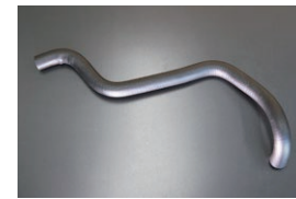
S30マスターバックホース (キャブ側) ¥3,500 ※日産品番 47474-E4101 相当品 (432Zは除く) (2025.11.24追加)