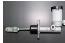
5/8クラッチマスターシリンダー 適合: KPGC10, PGC10 (GT-R用) サイズ: 5/8 価格: ¥23,000 (2025.7.21追加)