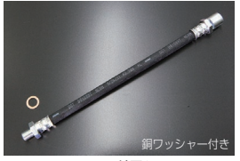
GC10, KPGC10 純正クラッチホース ・全長: 260mm (ねじ部込み) ・適合: GC10, KGC10, KPGC10 ・価格: ¥2,580 (2026.4.9更新)