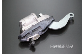
13/16標準ホイルシリンダー 適合: GC10, GC110, 510 価格: ¥63,900/1ヶ (更新 2026.05.07)