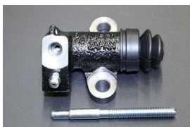
手動調整 3/4リレズシリンダー 適合: GC10/S30前期 サイズ: 3/4 価格: ¥10,800 (2026.4.9更新)