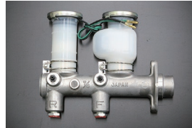
P330 ブレーキマスターシリンダー サイズ: 7/8 (日産純正ナブコ製) 適合: リヤドラム車 (L20/L28) (75.6~79.5) 価格: ¥89,000 (廃止 2026.4.9)