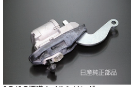
13/16標準ホイールシリンダー 適合: GC10, GC110, 510 価格: ¥62,000 /1ヶ (廃止 2026.4.9)