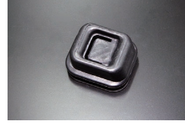
SR311クラッチフォークブーツ 適合: SR311全車/SP311 (後期) ※5速ミッション用 価格: ¥4,000