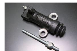
SR311 標準リレズシリンダー 適合: SR311全車/SP311 (後期) サイズ: 3/4 (手動調整) 価格: ¥13,410 (2026.4.9更新)