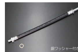
SR311/SP311 純正クラッチホース ・全長: 275mm (ねじ部込み) ・適合: SR311/SP311全車 ・価格: ¥4,210 (2026.4.9更新)