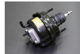
GC110 前期マスターバック サイズ: 外径143φ (ツメ部) ※スペーサー使用でハコスカ流用可 価格: ¥80,300 (2026.4.10更新) ※在庫限り