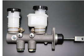
SR311 ブレーキマスターシリンダー サイズ: 3/4 適合: SR311,SP311 (67.5~70年) 価格: ¥59,000 ※右ハンドル車はフッシュロッドを現行品と差し替えて使用。左車はホルトオン