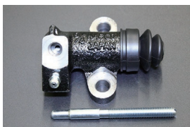
手動調整 3/4リレズシリンダー 適合: GC10/S30前期 サイズ: 3/4 価格: ¥10,800 (2026.4.9更新)