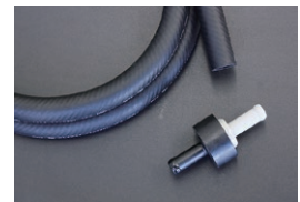
マスターバックホース&チェックバルブ ・汎用チェックバルブ ¥4,090 ・汎用マスターバックホース ¥4,820 (内径 9mm×1.5M) (2026.4.9更新)