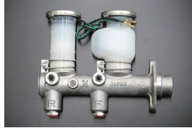
KHC130 ブレーキマスターシリンダー サイズ: 7/8 (日産純正ナブコ製) 適合: リヤドラム車 (L20) (75.6~80.10) 価格: ¥89,000 (廃止 2026.4.9)