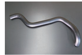
S30マスターバックホース (キャブ側) ¥3,500 ※日産品番 47474-E4101 相当品 (432Zは除く) (2025.11.24追加)