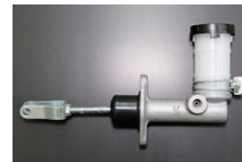
5/8クラッチマスターシリンダー 適合: KPGC10, PGC10 (GT-R用) サイズ: 5/8 価格: ¥23,000 (2025.7.21追加)