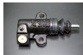
FJ20 標準リレズシリンダー 適合: FJ20全車 サイズ: 3/4 (自動調整) 価格: ¥7,530 (2026.4.9更新)