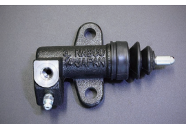
L型 3/4 リレズシリンダー Assy 品番: 30620-U7001-S サイズ: 3/4 (シングルシールタイプ) 適合: L型全車 (自動調整タイプ) 価格: ¥7,450 (2026.4.9更新)