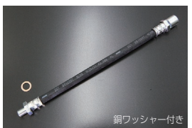
GC10, KPGC10 純正クラッチホース ・全長: 260mm (ねじ部込み) ・適合: GC10, KGC10, KPGC10 ・価格: ¥2,580 (2026.4.9更新)