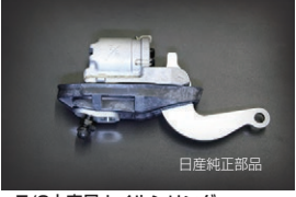
7/8大容量ホイールシリンダー 適合: GC10, GC110, 510 価格: ¥47,700 /1ヶ (廃止 2026.4.9)