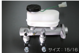
S130 ブレーキマスターシリンダー (後期 右ハンドル車用) サイズ: 15/16 適合: 81.10~83.8 (L20/L28) 価格: ¥49,000 ※パイプの取り付け位置が標準より6cm下がります。