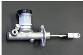
5/8クラッチマスターシリンダー (汎用タイプ) 適合: S30, GC110, C130, 510 価格: ¥13,500 (2026.4.9更新)