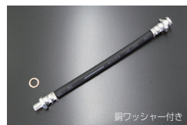
S30, S31, PS30 純正クラッチホース ・全長: 230mm (ねじ部込み) ・適合: S30, S31, PS30 ・価格: ¥3,270 (2026.4.9更新)