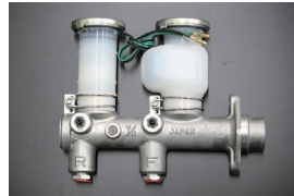
GC210 ブレーキマスターシリンダー サイズ: 7/8 (日産純正ナブコ製) 適合: リヤドラム車 (L20E) (77.8~81.7) 価格: ¥89,000 (廃止 2026.4.9)