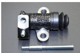
手動調整 3/4リレズシリンダー 適合: GC10/S30前期 サイズ: 3/4 価格: ¥8,710 (2025.4.13 更新)