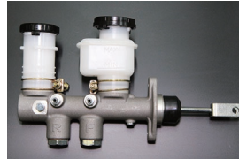
SR311 ブレーキマスターシリンダー サイズ: 3/4 適合: SR311,SP311 (67.5~70年) 価格: ¥59,000 ※右ハンドル車はフッシュロッドを現行品と差し替えて使用。左車はホルトオン