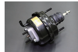
GC110 前期マスターバック サイズ: 外径143φ (ツマ部) ※スペーサー使用でハコスカ流用可 価格: ¥78,000 (2025.4.13 更新)