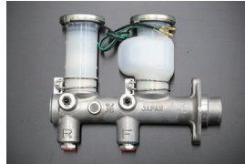
GC110 ブレーキマスターシリンダー サイズ: 7/8 (日産純正ナブコ製) 適合: GC110後期型, GC111 (リヤドラム車 75.10~77.7) 価格: ¥82,500 (2025.4.13 更新)