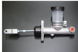
5/8クラッチマスターシリンダー 適合: GC10, KGC10 (GT, GTX用) サイズ: 5/8 ※クレビスは純正に交換必要 価格: ¥15,000