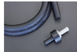
マスターバックホース&チェックバルブ ・汎用チェックバルブ ¥3,970 ・汎用マスターバックホース ¥4,680 (内径 9mm×1.5M) (2025.4.13 更新)