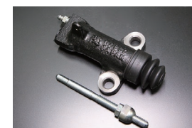
SR311 標準リレズシリンダー 適合: SR311全車/SP311 (後期) サイズ: 3/4 (手動調整) 価格: ¥10,890 (2025.4.13 更新)