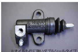
L型 3/4 リレズシリンダー Assy 品番: 30620-69F70-W サイズ: 3/4 (ダブルシールタイプ) 適合: L型全車 (自動調整タイプ) 価格: ¥6,650 ※オイルもれに強いダブルシールタイプ