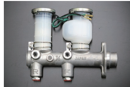
GC210 ブレーキマスターシリンダー サイズ: 7/8 (日産純正ナブコ製) 適合: リヤドラム車 (L20E) (77.8~81.7) 価格: ¥82,500 (2025.4.13 更新)