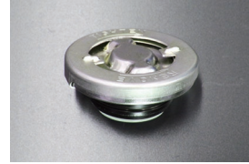
ブレーキマスターシリンダーキャップ 品番: K2401 適合: S30,S31,GC10~GC210 KHC130,P330 他 価格: ¥2,350 (2025.4.13 更新)