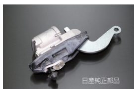
13/16標準ホイールシリンダー 適合: GC10, GC110, 510 価格: ¥47,700/1ヶ (2025.4.13 更新)