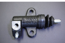
L型 3/4 リレズシリンダー Assy 品番: 30620-U7001-S サイズ: 3/4 (シングルシールタイプ) 適合: L型全車 (自動調整タイプ) 価格: ¥6,020 (2025.4.13 更新)