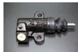
FJ20 標準リレズシリンダー 適合: FJ20全車 サイズ: 3/4 (自動調整) 価格: ¥6,090 (2025.4.13 更新)