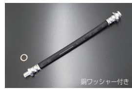
S30, S31, PS30 純正クラッチホース ・全長: 230mm (ねじ部込み) ・適合: S30, S31, PS30 ・価格: ¥3,260