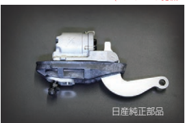
7/8大容量ホイールシリンダー 適合: GC10, GC110, 510 価格: ¥47,700/1ヶ (2025.4.13 更新)