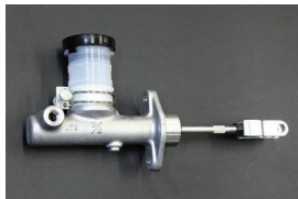
5/8クラッチマスターシリンダー (汎用タイプ) 適合: S30, GC110, K130, 510 価格: ¥13,100 (2025.4.13 更新)