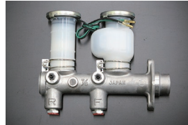
P330 ブレーキマスターシリンダー サイズ: 7/8 (日産純正ナブコ製) 適合: リヤドラム車 (L20/L28) (75.6~79.5) 価格: ¥82,500 (2025.4.13 更新)