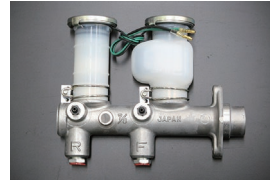
S30 ブレーキマスターシリンダー サイズ: 7/8 (日産純正ナブコ製) 適合: S30,S31 (75.8~78.9) 価格: ¥82,500 (2025.4.13 更新)