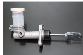
5/8クラッチマスターシリンダー 適合: GC210, GC211 (GT, GTX用) サイズ: 5/8 価格: ¥11,000