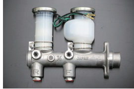
KHC130 ブレーキマスターシリンダー サイズ: 7/8 (日産純正ナブコ製) 適合: リヤドラム車 (L20) (75.10~80.10) 価格: ¥82,500 (2025.4.13 更新)