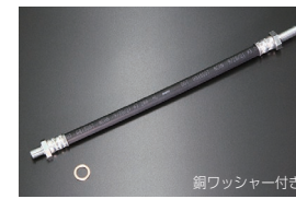
SR311/SP311 純正クラッチホース ・全長: 275mm (ねじ部込み) ・適合: SR311/SP311全車 ・価格: ¥4,080 (2025.4.13 更新)