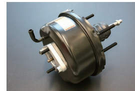
GC110 後期マスターバック 後期用ピッキサイズです。(162φ) 前期に付ければ制動力アップ。 ¥66,900 ※ボディ加工とスペーサーでGC10取付可 (2025.4.13 更新)