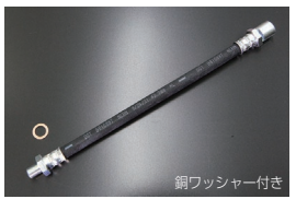
GC10, KPGC10 純正クラッチホース ・全長: 260mm (ねじ部込み) ・適合: GC10, KGC10, KPGC10 ・価格: ¥2,500 (2025.4.13 更新)