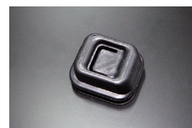
SR311クラッチフォークブーツ 適合: SR311全車/SP311 (後期) ※5速ミッション用 価格: ¥4,000