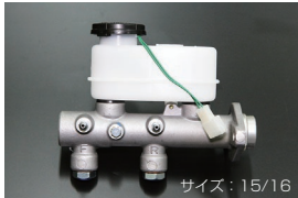
S130 ブレーキマスターシリンダー (後期 左ハンドル車用) サイズ: 15/16 適合: 81.10~83.8 (L20E) 81.10~83.8 (L28E) 価格: ¥42,000