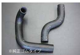
S30 前期中期ラジエーターホース

原動機：L20 適合：GC10/KGC10 価格：アッパーホース ¥3,000 ロアホース ¥4,000