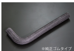
S54Bウォーターバイパスホース

※ヘッド前に取り付けるバイパスホース 純正品番 21018-R2000 相当品 原動機：FJ20E(T) 価格：¥1,800