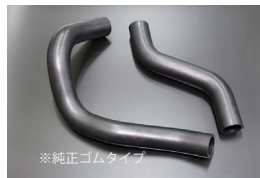
G610サメブル ラジエーターホース

復刻布目仕様ラジエーターホース 価格：アッパー ¥3,000 ロア ¥4,000