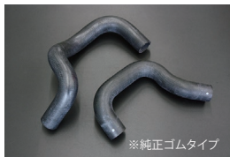
DR30ラジエーターホース

原動機：FJ20E/FJ20ET 適合：前期後期共通 価格：アッパーホース ¥3,500 ロアホース ¥3,500