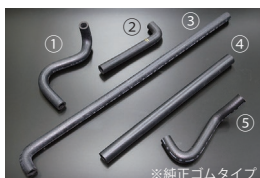
GC10 後期ヒーターホースSET

適合：GC10 (1971~) 2000GT 価格：¥8,900/SET ※単品：① ¥2,800 ② ¥1,590 ③ ¥1,820 ④ ¥1,190 ⑤ ¥1,500