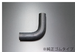
S31 ヒーターコアアウト側ホース