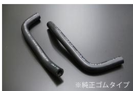
DR30ウォーターホースSET

※ウォーターハウジングとウォーターポンプをつなぐホース 原動機：FJ20E(T) 価格：¥4,800/SET