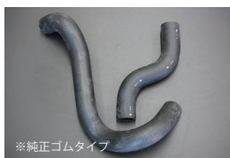
S30 後期/S31 ラジエーターホース