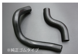
GC110 ラジエーターホース

(GC111 共用) ・アッパーホース ¥2,500 ・ロアホース ¥3,500