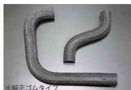
GC10 網目ラジエーターホース

原動機：L20 適合：GC10/KGC10 価格：アッパーホース ¥3,000 ロアホース ¥4,000