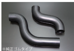
S54B/S54Aラジエーターホース

原動機：VG30DE 価格：アッパー3本セット ¥16,000 ロア ¥6,500