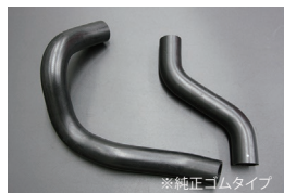
HR30ラジエーターホース

原動機：L20 適合：ローレル セダン、HT共通 価格：アッパーホース ¥2,500 ロアホース ¥3,500