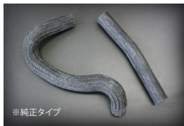
SR311ラジエーターホース

原動機：FJ20E/FJ20ET 適合：前期後期共通 価格：アッパーホース ¥3,500 ロアホース ¥3,500