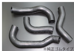
Z31 ラジエーターホース

中補強メッシュと肉厚設計による強化タイプ 原動機：RB20DET 価格：アッパー2本セット ¥8,000 ロア ¥6,000