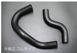
230/330ラジエーターホース

原動機：L20/L28 適合：後期 価格：アッパーホース ¥2,500 ロアホース ¥3,500