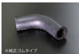
DR30ウォーターバイパスホース

※ウォーターハウジングとウォーターポンプをつなぐホース 適合：KPGC10,PS30 価格：¥2,500