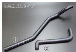
510ヒーターホースセット

適合：GC10 (1971~) 2000GT 価格：¥8,900/SET ※単品：① ¥2,800 ② ¥1,590 ③ ¥1,820 ④ ¥1,190 ⑤ ¥1,500