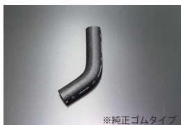
S30 ヒーターコック下側ホース

適合：プリンス スカイライン 原動機：G7 価格：アッパー ¥5,500 ロア ¥4,500