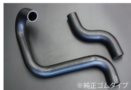
S130ラジエーターホース

原動機：L20/L28 適合：前期 価格：アッパーホース ¥2,500 ロアホース ¥3,500