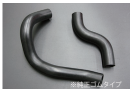
GC210ラジエーターホース

原動機：L20/L20ET 適合：スカイライン 前期後期共通 価格：アッパーホース ¥2,500 ロアホース ¥3,500