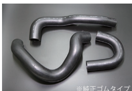
Z31 ラジエーターホース

(GC111 共用) ・アッパーホース ¥2,500 ・ロアホース ¥3,500