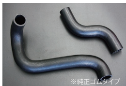
S130ラジエーターホース

原動機：L20/L20ET 適合：GC211共通 価格：アッパーホース ¥2,500 ロアホース ¥3,500