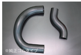
510 ラジエーターホース

原動機：L20,L26,L28 適合：セドグロ セダン、HT共通 価格：アッパーホース ¥2,500 ロアホース ¥3,500