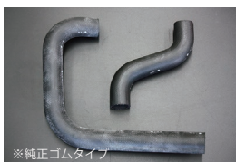
GC10 ラジエーターホース

原動機：L20 適合：610ブルーバード 価格：アッパーホース ¥2,500 ロアホース ¥3,500