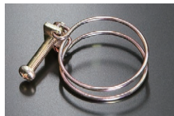
ラジエーターホース用ワイヤークランプ

原動機：L20,L24,L26,L28 適合：シリンダーブロック及びヘッド 価格：¥850 ※ネジ直径 20.9 (ステンレス製)