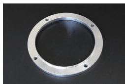
L6用 カップリングファンセーサー

仕様：385mm 7枚羽 適合：L型全車 (2026.4.15 更新) 価格：¥32,370/SET (カップリング¥22,800 ファン¥9,570)