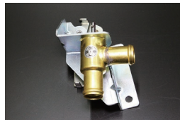
GC10後期ヒーターコック