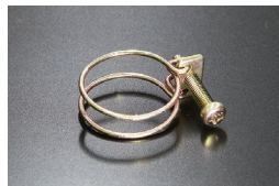
19φヒーターホース用ワイヤークランプ

当時の仕様 (複製品) 適合：L型全車、他 (34φホース用) 価格：¥850 ※クロメートメッキ、+丸頭ボルト