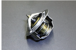
純正 サーモスタット 76.5度 適合：L型FJ20,A型,S20,U20 G7,R16 価格：¥2,290