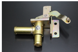
S30前期ヒーターコック