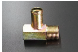
L6用 16φ-L型 ヘッドヒーターコネクター (ネジサイズ 1/2 ネジ径20.9)