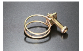
16φヒーターホース用ワイヤークランプ

当時の仕様 (複製品) 適合：L型全車、他 価格：¥700 ※クロメートメッキ、+丸頭ボルト