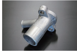
L型19φウォーターインレット (ヒーターホース口 19φ) ※S48~S50年のS30,GC110,C130 等に標準的に使用されるタイプ。 価格：¥1,280