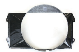
S30 FRPファンシュラウド

※ファンを前方に8mmオフセットさせるパーツ ・厚み...8mm ・付属品...ロングボルト4本 ・価格：¥4,600