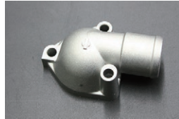
純正 L型サーモカバー(3本ボルト) 適合：L型 車種：S130,GC210等 価格：¥1,590