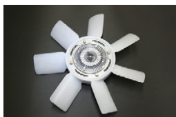
L6 カップリング+ファンセット

仕様：385mm 7枚羽 適合：L型全車 (2026.4.15 更新) 価格：¥32,370/SET (カップリング¥22,800 ファン¥9,570)