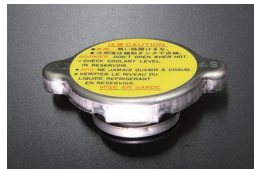
日産純正 ラジエーターキャップ

(2026.4.15 更新) 50φ ¥260 40φ ¥250 35φ ¥250 25φ ¥260