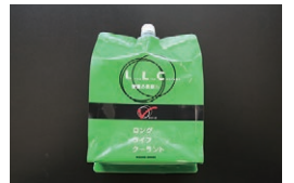
日産純正 ロングライフクーラント