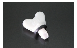
日産純正 ラジエータードレンコック

適合：S30~S130, GC10~R30 B110~B310, KHC130 他 価格：¥590