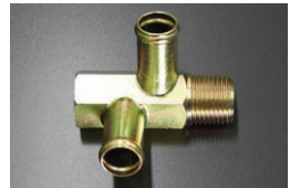
S130Z用 ヘッドヒーターコネクター (16φ二又ネジサイズ1/2 ネジ径20.9)