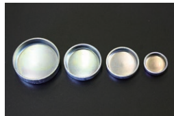
シリンダーブロック ツバ付きプラグ

・ヒーターコネクター 14-17φ二又 ¥4,800 ・ヒーターパイプ 14φストレート ¥4,600 ・ヒーターコネクター 14φ-3/8 ¥1,500