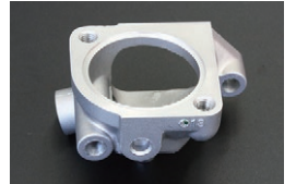
L型 シンプルサーモハウジング 水温センサー以外の余計なセンサー取り出し や水の取り出し口の無いスッキリタイプ。 ※SOLEX,WEBER,OER取付車に最適 価格：¥2,040