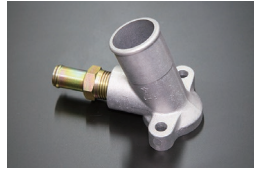
L型16φウォーターインレットSET (コネクター取付部ねじ式) ※ダイレクトにヒーターホースをつなげ たい時に使用。(2026.4.15 更新) 価格：¥13,730/SET