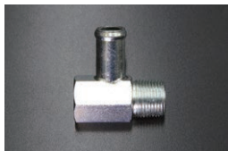
A型ヘッドヒーターコネクター

品番：27190-N3100 (相当品) 適合：S30,S31 (1973.09~) 価格：¥18,000 ※室内とエンジンルームをバイパスするパーツ