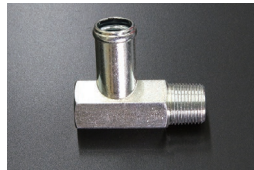
L4用 16φ-L型 ヘッドヒーターコネクター (ネジサイズ 3/8 ネジ径16.6)