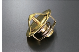
純正 サーモスタット 82度 適合：L型FJ20,A型,S20,U20 G7,R16 価格：¥1,650