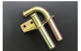
S30ヒーターホースジョイント

品番：27190-N3100 (相当品) 適合：S30,S31 (1973.09~) 価格：¥18,000 ※室内とエンジンルームをバイパスするパーツ