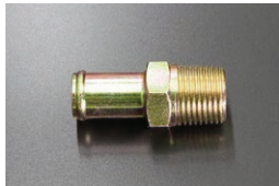
L6用 16φストレート ヘッドヒーターコネクター (ネジサイズ 1/2 ネジ径20.9)