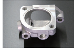
L型 STD サーモハウジング 適合：ワンキャブ、SUキャブ車 車種：S30,GC10,GC110,KHC130 価格：¥2,890