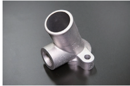
L型 1/2ウォーターインレット (コネクター取付部ねじ式) ※S50年8月以降のS30後期、S31 等に標準的に使用されるタイプ。 価格：¥9,730