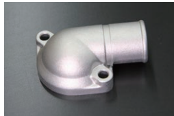
純正 L型サーモカバー(2本ボルト) 適合：L型 車種：S30,GC10,510 等 価格：¥2,040