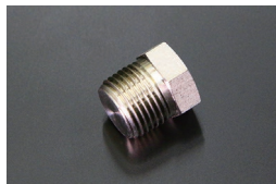
L型 1/2シリンダープラグ

原動機：L20,L24,L26,L28 適合：シリンダーブロック及びヘッド 価格：¥850 ※ネジ直径 20.9 (ステンレス製)