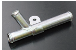
L6用 19-16-19ヒーターコネクター (ブロックサイドに取付けるパーツ)