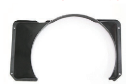
510 FRPファンシュラウド