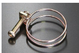
ラジエターホース用ワイヤークランプ 当時の仕様 (復刻品) 適合：L型全車、他 (34φホース用) 価格：¥850 ※クロメートメッキ、+丸頭ボルト