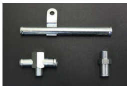
TA22/TA17 2TG用 ・ヒーターコネクター 17-17φ二又 ¥4,800 ・ヒーターパイプ 17φストレート ¥4,600 ・ヒーターコネクター 17φ-3/8 ¥1,500