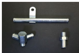
TE27 2TG用 ・ヒーターコネクター 14-17φ二又 ¥4,800 ・ヒーターパイプ 14φストレート ¥4,600 ・ヒーターコネクター 14φ-3/8 ¥1,500