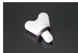
日産純正 ラジエタードレンコック 適合：S30~S130, GC10~R30 B110~B310, KHC130 他 価格：¥590