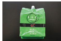
日産純正 ロングライフクーラント 適合：全車 容量：2リットル (色：グリーン) 価格：¥2,100