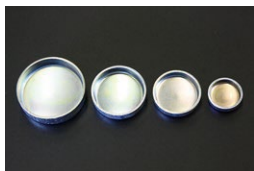
シリンダーブロック ツバ付きプラグ 50φ ¥250 40φ ¥250 35φ ¥250 25φ ¥250