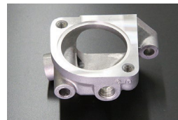
L型 STD サーモハウジング 適合：ファンキャブ、SUキャブ車 車種：S30,GC10,GC110,KHC130 価格：¥2,810 (2025.4.7 更新) ※1/4サイズの水の取り出し口あり