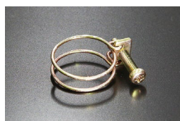
19φヒーターホース用ワイヤークランプ 当時の仕様 (復刻品) 適合：L型全車、他 価格：¥700 ※クロメートメッキ、+丸頭ボルト