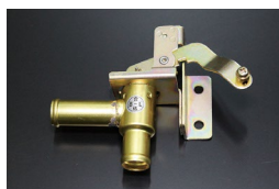
S30前期ヒーターコック 適合：1969/10~1973/9 価格：¥30,500 (2025.1.7 更新)