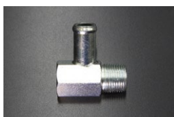
A型ヘッドヒーターコネクター ・ネジサイズ 3/8 (ネジ径16.6) ・ホース口サイズ 12.7φ 価格：¥870 (2025.12.16 追加)