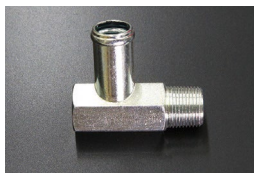
L4用 16φ-L型 ヘッドヒーターコネクター (ネジサイズ 3/8 ネジ径16.6) 価格：¥1,000 (2025.4.7 更新)