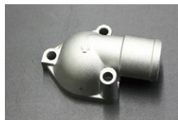
純正 L型サーモカバー(3本ボルト) 適合：L型 車種：S130,GC210等 価格：¥1,540 (2025.4.7 更新)