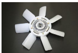
L6 カップリング+ファンセット 仕様：385mm 7枚羽 適合：L型全車 価格：¥32,090/SET (カップリング¥22,800 ファン¥9,290) (2025.4.7 更新)