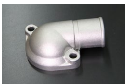
純正 L型サーモカバー(2本ボルト) 適合：L型 車種：S30,GC10,S10 等 価格：¥1,980 (2026.03.27 更新)