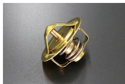
純正 サーモスタット 82度 適合：L型 FJ20.A型,S20,U20 G7,R16 価格：¥1,600 (2025.4.7 更新)