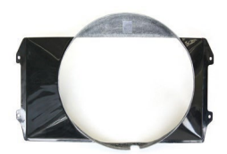
S30 FRPファンシュラウド 年式：S44.10~S49.9 適合：S30/HS30 価格：¥20,000