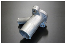
L型19φウォーターインレット (ヒーターホース口 19φ) ※S48~S50年のS30,GC110,C130 等に標準的に使用されるタイプ。 価格：¥1,240 (2025.4.7 更新)