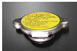
日産純正 ラジエターキャップ 適合：GC10,GC110,GC210 C130,S30,S130 価格：¥4,090 (2025.10.12 更新)