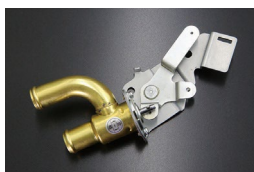
S130ヒーターコック 適合：S130全年度適合 (Z・T及びオートエアコン車不可) 価格：¥18,000 (2025.4.7 更新)