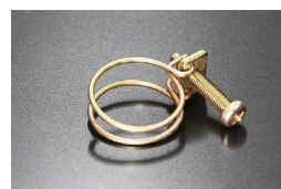
16φヒーターホース用ワイヤークランプ 当時の仕様 (復刻品) 適合：L型全車、他 価格：¥650 ※クロメートメッキ、+丸頭ボルト