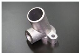
L型 1/2ウォーターインレット (コネクター取付部ねじ式) ※S50年8月以降のS30後期、S31 等に標準的に使用されるタイプ。 価格：¥9,730 (2025.1.7 更新)