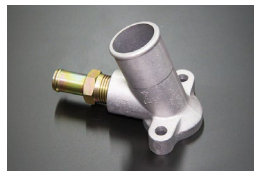
L型16φウォーターインレットSET (コネクター取付部ねじ式) ※ダイレクトにヒーターホースをつなげ たい時に使用。(2025.1.7 更新) 価格：¥13,230/SET