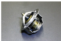
純正 サーモスタット 76.5度 適合：L型 FJ20.A型,S20,U20 G7,R16 価格：¥1,850 (2025.4.7 更新)