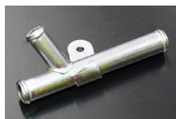
L6用 19-16-19ヒーターコネクター (ブロックサイドに取付けるパーツ) (2025.4.7 更新) 価格：¥900