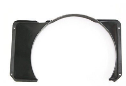
510 FRPファンシュラウド 年式： 適合：510全車 価格：¥15,000