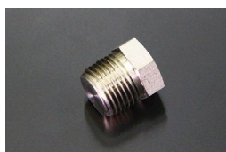
L型 1/2シリンダープラグ 原動機：L20,L24,L26,L28 適合：シリンダーブロック及びヘッド 価格：¥850 ※ネジ直径 20.9 (ステンレス製)