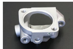
L型 シンプルサーモハウジング 水温センサー以外の余計なセンサー取り出し や水の取り出し口の無いスッキリタイプ。 ※SOLEX,WEBER,OER取付車に最適 価格：¥1,980 (2025.4.7 更新)