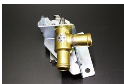
GC10後期ヒーターコック 適合： 価格：¥61,800 (2025.1.7 更新)