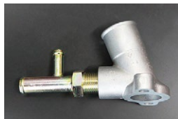
L型16-10ウォーターインレットSET (コネクター取付部ねじ式) ※S50年8月以降のS30後期、S31 等に標準的に使用されるタイプ。 価格：¥14,730/SET (2025.1.7 更新)