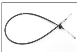
Z31 前期アクセルワイヤー