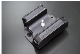
S30 純正デフマウント 原動機：L20 適合：S30、S31 価格：¥6,670 (2026.4.10 更新)