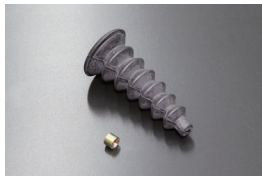
S30 アクセルリンクゲージブーツ (2026.4.10 更新) 価格：¥1,420