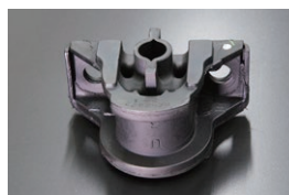
S130 R200純正デフマウント 価格：¥6,530 (2026.4.10 更新)