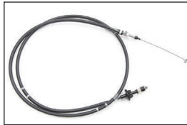
Z31 後期アクセルワイヤー 適合：Z31(RB20) 1985.10~ (18201-20P00 相当品) 価格：¥16,000