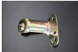
S30 アクセルリンクサポート 8φ軸のリンクゲージがしっかり入るボールジョイント付き 価格：調整中