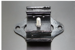
S30 純正ミッションマウント 原動機：L20、L24、S20 適合：S30、PS30 価格：¥5,020 (2026.4.10 更新)