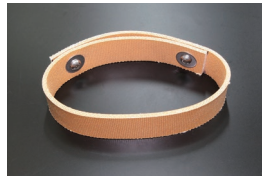
S30 強化デフアレーシアルベルト 適合：S30、S31 価格：¥16,500