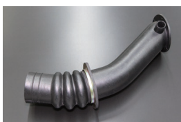
S30,240Z フューエルタンクホース 適合：S30,HS30 (~74.10まで) 価格：¥13,400 (2026.4.10 更新)