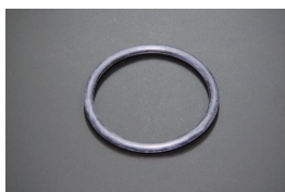
フューエルゲージ オリング 適合：S30,SR311,SP311 GC10,GC110,510,C130,230,330 価格：¥1,560 (2026.4.10 更新)