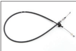
Z31 前期アクセルワイヤー 適合：Z31(RB20) ~1985.10 (18200-11P00 相当品) 価格：¥16,000 ※オートクルーズ車不可