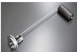
S30前期フューエルタンクユニットゲージ 適合：S30前期 価格：¥153,000 (2025.2.14 更新)