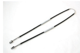
S30 前期サイドブレーキワイヤー (複製品 36543-N3000 相当品) (2025.7.20 更新) ¥27,000