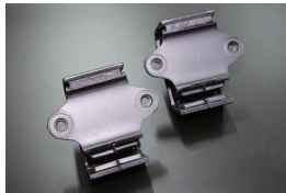
S30,S130 純正エンジンマウントSET 原動機：L20、L24、S20 適合：S30、PS30、S130 価格：¥10,260/SET (2026.4.10 更新)