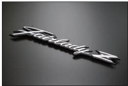
S30 Fairady-Z エンブレム ※フェンダー用(日産純正 金属製) (廃止 2026.4.10) 価格：¥19,300/1ヶ