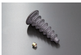
S30 アクセルリンクゲージブーツ