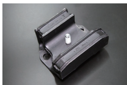
S30 純正デフマウント

原動機：L20、L24、S20 適合：S30、PS30、S130 価格：¥9,820/SET