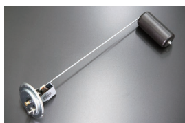
S30前期フューエルタンクユニットゲージ