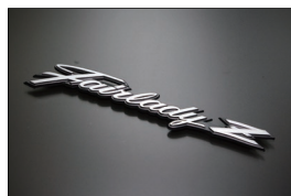
S30 Fairady-Z エンブレム

・穴の芯間長さ 59mm ・板の厚み 13mm ・価格 ¥8,660/2ヶSET