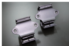
S30, S130 純正エンジンマウントSET

原動機：L20、L24、S20 適合：S30、PS30、S130 価格：¥9,820/SET