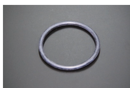
フューエルゲージ Oリング

適合：S30, SR311, SP311 GC10, GC110, S10, C130, 230, 330