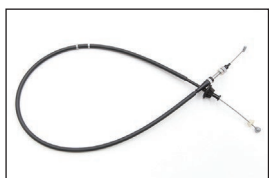
Z31 前期アクセルワイヤー