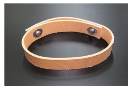
S30 強化デフアレーシヤルベルト