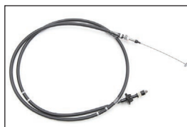
Z31 後期アクセルワイヤー