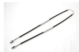
S30 前期サイドブレーキワイヤー