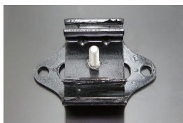
S30 純正ミッションマウント