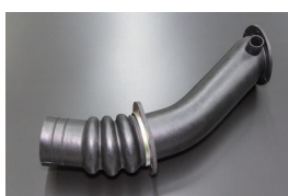
S30, 240Z フューエルタンクホース