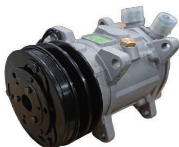
UP120-125AA-12V-U04 国産旧車小型車 2000cc以下サニー・レビンなど ¥70,000