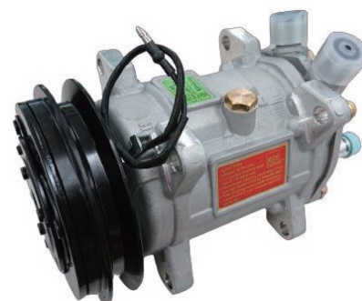
UP150-135B-ALIG16-12V-U04 国産旧車2000cc以上クラス ¥77,000 (更新 2026.07.06)