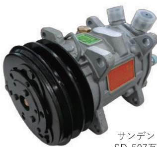
UP120-132AA-12V-U04 国産旧車小型車 2000cc以下サニー・レビンなど ¥70,000