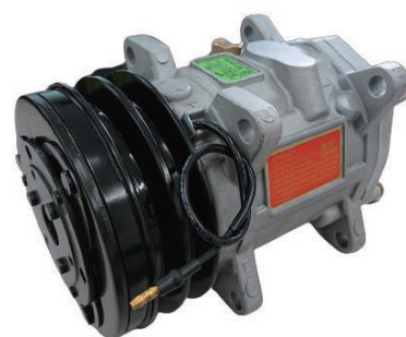
UP120-125AA-12V-DD 国産旧車小型車 2000cc以下サニー・レビンなど ¥70,000