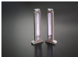
内部カットモデル

リフター軸部とヘッド部の独立した2つの原子同士を、圧接という手法で金属融合し一体化させました。カムシャフトの当たり面はバフ仕上げで面粗度を向上させ、その後リン酸マンガン皮膜処理を施工。油膜保持性を高め耐摩耗を強化しました。