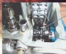
削りだしクロモリスプロケット ジュラルミンスライドプレート クロモリスライドプレート