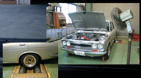
BOSCHジャーシーダイナモによるパーツの性能試験