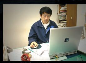
CADによるパーツ設計