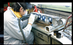
機械加工後、メカニックによるリユーター作業