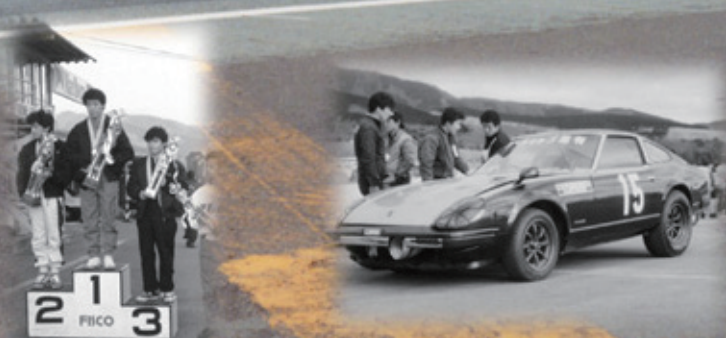
RRCドラッグレースin富士

亀有の原点がここにある。 この舞台で結果を残すために エンジンの全てを 極める必要があった。 長い戦いのスタート地点である。