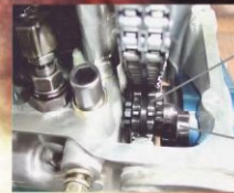
削りだしクロモリスプロケット