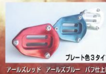
・L6 ¥52,500 (本体¥50,000)