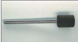
ロングゴム砥石 (ポート用)

6φ軸 #120 #240 (トイシサイズ: 20φ×25 全長: 110) 超硬バーでの粗加工後の中間仕上げ用。