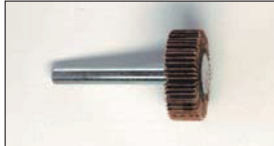
フラップホイール小 (6φ軸)

ブロックやヘッドの面修正やロッカーアームのキズ取り、エキゾーストポート磨きなど紙と違い切れずらい布タイプ。 ¥200/1枚