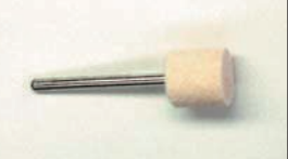
フェルトパッド(3φ軸) ¥700

#80 #120 #180 #220 #320 (トイシサイズ: 8φ×20 全長: 50) 燃焼室の鏡面加工仕上げ用として便利な砥石で簡単に鏡面仕上げができる。