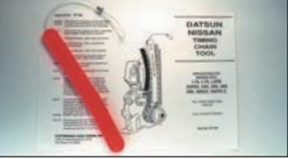
L型チェーンテンショナー止り ¥3,700

落下しても割れないバルブ専用分度器。コンパクトタイプなので、ほとんどのエンジンに使用できる。(1度読み)