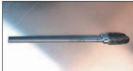
ロング超硬バー(ポート研磨用)(6φ軸) ¥14,500

アダプターにより6φ3φ軸が共に使えてポート研磨、燃焼室加工、コンロッド軽量などすべての研磨作業に対応。