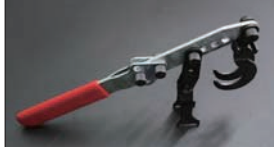
バルブスプリングコンプレッサー ¥7,000

油や熱に強くシリコンブロックの塗装に最適です。日産純正色に拘りを持つユーザーの為の純正ブルーです。