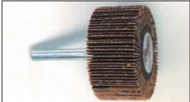
フラップホイール大 (6φ軸)

フラップサイズ: 30φ×10 全長: 100) インマニヤインテークポートの奥の方を磨くのに便利なロング仕様。