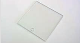
測定用アクリル板 ¥1,800

20cc ¥2,300 50cc ¥3,600 圧縮比調整のためのヘッドガスケット厚みやヘッド研量の選択には欠かせない測定ツール。