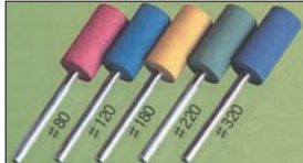
セラミック砥石(3φ軸)

3φ軸 #120 #320 #400 (トイシサイズ: 8φ×20 全長: 50) 超硬バーでの粗加工後の中間仕上げ用。コンロッド内側面にもOK。