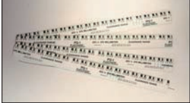
プラスチックゲージ (4本入り) ¥3,700

(最大秤量1kg/単位0.5g) ピストンやコンロッド、ロッカーアームなどの精密な重量バランス取りが可能。(単一電池4ヶ必要)