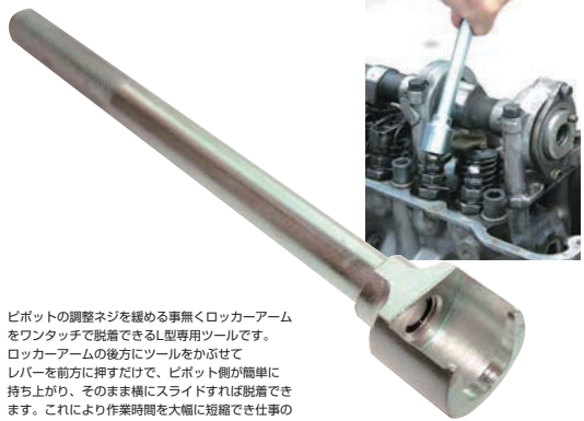
L型ロッカーアーム脱着ツール

ピボットの調整ネジを緩める事無くロッカーアームをワンタッチで脱着できるL型専用ツールです。ロッカーアームの後方にツールをかぶせてレバーを前方に押しただけで、ピボット側が簡単に持ち上がり、そのまま横にスライドすれば脱着できます。これにより作業時間を大幅に短縮でき仕事の効率を上げられます。