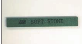
オイルストーン (面取り用) ¥700