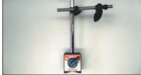
マグネットベース ¥6,000

80mm延長棒 ¥1,500 バルブには絶対不可欠なツール。20mmストロークでハイリフトにも対応できる。