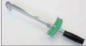
プレート型トルクレンチ ¥15,000

(オイルクリアランス測定用) メタルとクリアランスの隙間に糸状のゲージを上下入れ、つぶれ具合からクリアランスを測定できる。(0.025~0.076mm)