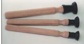
バルブタコ棒 25φ 30φ 35φ 各¥500

バルブすり合わせ用のコンパウンドでバルブとシートリングの当たり面をなじませるのに使用。