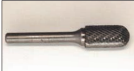
超硬バー (コンロッド加工用) ¥11,600

L型エンジンの複雑な燃焼室形状変更に適した超硬バーでバルブプラグ廻りも、これさえあればOK。