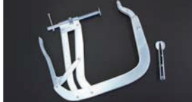
バルブスプリングコンプレッサー (レバー式) ¥18,000

ワンアクションでスプリングを締められることのできるレバー式。(L型、A型、K型等のOHC用)