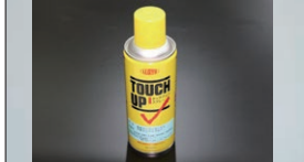
日産エンジンブルー ¥1,500

約#3000に相当する金属みがき剤。クランクピン&ジャーナルやコンロッド、燃焼室等の鏡面みがき用に最適。