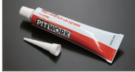
液体ガスケット (ベンガラ) ¥2,900

(バッテリー/CDI/MDI対応) バッテリー電源で使用できる電池不要タイプ。点火系を強化していても確実に反応し正確な点火時期を映し出します。