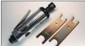
エアリーユーター ¥15,000

アダプターにより6φ3φ軸が共に使えてポート研磨、燃焼室加工、コンロッド軽量などすべての研磨作業に対応。