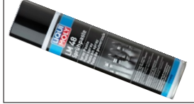
LM48 エンジン組み付け用スプレー ¥3,600

エンジン、ミッション、デフ、の組み付けに最適な液状ガスケットで塗布後約5分くらいで固まりはじめる。