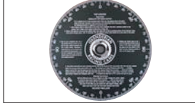
イスキー分度器 (178φアルミ製) ¥3,600

ダイヤルゲージを固定するのに便利なマグネット式。ゲージが振れずしっかりと固定できる。