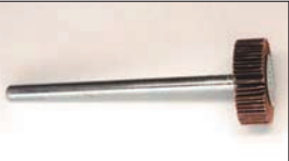
ロングフラップホイール (6φ軸)

(フラップサイズ: 30φ×10 全長: 52) インテークポートの最終仕上げ用。バルブに近づくにしたがって細かくする。