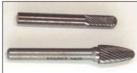
超硬バー (燃焼室加工用)(6φ軸)

ポート研磨には無くてはならない必需品。これ一本あればIN、EXポート及びバルブガイド廻りの肉取りもOK。