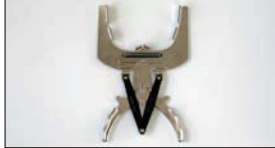
ピストンリングエキスパンダー

(20~130N・m) 従来型のプレート式でプリセットでは管理できないバルブの伸びも確認できる。(2~13kg/m相当)