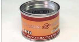
バルブコンパウンド (細目) ¥1,700

バルブすり合わせ用のコンパウンドでバルブとシートリングの当たり面をなじませるのに使用。