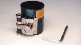
ピストンリングコンプレッサー (60~125φ対応) ¥2,400