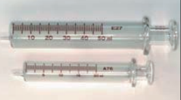
ガラス注射筒(燃焼室容積測定用)

20cc ¥2,300 50cc ¥3,600 圧縮比調整のためのヘッドガスケット厚みやヘッド研量の選択には欠かせない測定ツール。