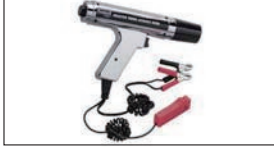
タイミングライト ¥25,000

クラッチ交換時に面倒なセンター出し作業がこれで解消できる。(L型、FJ20、CA、RB、VG、SR20、S20用)