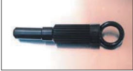
クラッチセンター出しツール 日産用 ¥2,500

カム交換の際にテンショナーが飛び出してしまわないためのお助けツール。プラスチック製で抜き差し簡単。