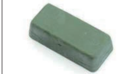
青棒 110g ¥1,000

アルミのつや出し用で燃焼室に適している。ネリ状なので布につけて磨くだけで十分なツヤが得られる。