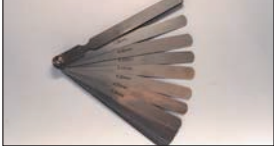
シックネスゲージ ¥4,600

(0.03~1.0mm 全長: 150mm) 18枚セットの持ちやすいロングタイプ。バラして1枚で使用することもできクリアランス確認が簡単ができる。