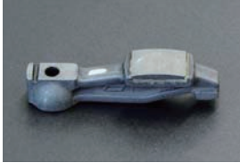
L型 日産純正ロッカーアーム ・L4 セット ¥23,920 ・L6 セット ¥35,880 ・単品 ¥2,990