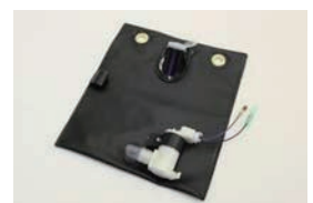
汎用ウインドワッシャータンク サイズ: 260×230 ¥6,570 ¥7,820