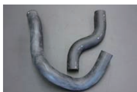
GC110 ラジエーターホース (GC111 共用) ・アッパーホース ¥1,990 ¥2,500 ・ロアホース ¥3,420 ¥3,500