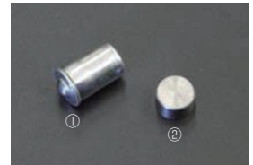
L型 オイルリリーフバルブ&プラグ ①リリーフバルブ ¥300 ※標準装備品でフィルターの目詰まり時のリリーフ回路(リレフ) ②リリーフプラグ ¥800 ※高油圧高回転でもリリーフさせず、確実にフィルターを通す