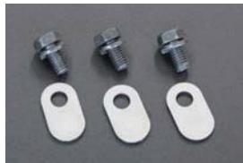
L6カムホルダーオイルシャワープラグ ¥1,200/SET ・L型前期型エンジンにセンター給油カムを装着した時に必要なオイル通路柱。