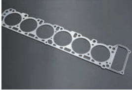
純正ヘッドガスケット ・L28 ¥3,840 ¥3,760 ・L24/L26 ¥5,140 ¥5,240