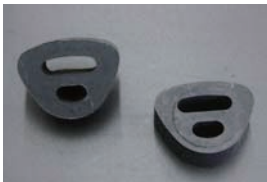
GC10, GC110 マフラーつりゴム SET ¥2,100/2ヶ SET