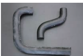
GC10 ラジエーターホース ・アッパーホース ¥1,310 ¥1,560 ・ロアホース ¥1,990 ¥2,370