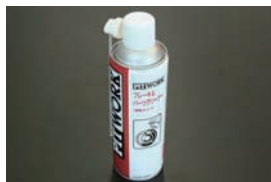
日産純正パーツクリーナー (480ml) ¥1,300 エンジンパーツやブレーキ回りの洗浄に最適。速乾タイプなのでパーツに水滴が付きづらい。