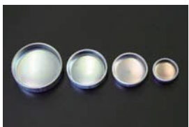
シリンダーブロック ツパ付きプラグ 50φ ¥250 40φ ¥250 35φ ¥250 25φ ¥250