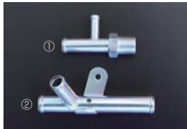
L6 ブロック横ヒーターコネクタ ①16-10φコネクタ ¥1,920 ②19-16-19φコネクタ ¥750