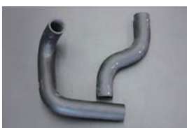
S30 前期中期ラジエーターホース (~S49.9) ・アッパーホース ¥1,990~¥2,500 ・ロアホース ¥1,690~¥2,010