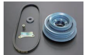
L6 クーラー用プリーキット ¥18,290/KIT