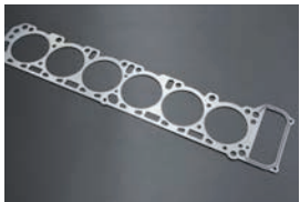
純正ヘッドガスケット ・L28 ¥3,840 ¥3,760 ・L24/L26 ¥5,140 ¥5,240