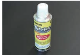
亜鉛メッキスプレー ¥1,610 S20 シリンダーライナーの外周やL型等のウォータージャケット内の錆止めに長期間効果がある。(耐熱温度 200~300度)