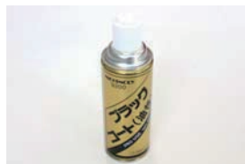
シャシーブラック ¥1,080 車の下まわりの錆止め塗装に最適な油性ツヤありタイプ。