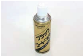
シャーシーブラック ¥1,080 車の下まわりの錆止め塗装に最適な油性ツヤありタイプ。