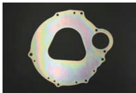
L型 バックプレート ※~S52 マニアルミッション車用 ¥1,610