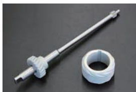
L型 スピンドルギヤ (後期型) ¥6,240 ¥11,000 L型 オイルポンプギヤ (日産純正品) ¥2,630