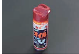
オイルスプレー (220ml) ¥800 カム、クランク、コンロッド、シリンダーなどの保管時の錆止めに便利なスプレー式オイル。