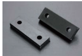
S30, S31 マフラーつりゴム SET ・穴の芯間長さ 59mm ・板の厚み 13mm ・価格 ¥2,080/2ヶ SET