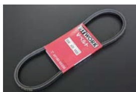
L型 ファンベルト (標準品) ・AY160-VA330 ¥950 ・AY160-VA335 ¥1,050 ・AY160-VA340 ¥1,050 ・AY160-VA345 ¥1,050