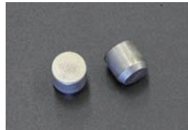
L型 オイルギャラリープラグ (シリンダーブロック) ¥170/1ヶ