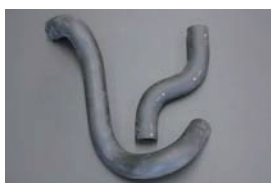
S30 後期/S31 ラジエーターホース (S49.10~) ・アッパーホース ¥1,990 ¥2,500 ・ロアホース ¥2,920 ¥3,500