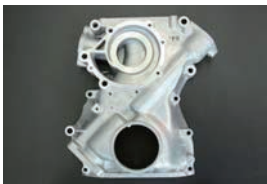
L型 フロントカバー ¥7,700