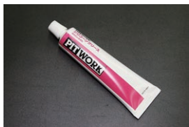
日産純正シリコングリス ¥2,700