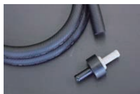
マスターバックホース&チェックバルブ 汎用チェックバルブ ¥3,380 汎用マスターバックホース ¥3,910 (内径9mm×1.5M)