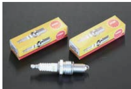
NGK グリーンプラグ ・ならし運転や街乗り用プラグ 品番: BP4EY~BP6EY 適合: L型, A型, U20, 2TG, 18RG, 4K 価格: ¥430