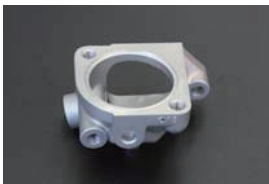
L型 シンプルサーモハウジング 余計なセンサー取り出しやヒーターホース取り出しなどの無いスッキリタイプ。 ¥1,540