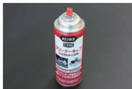
キャブクリーナー (420ml) ¥1,200 ソレックスやウエーバーの内部や外観の頑固な油污を簡単に落とせる強力クリーナー