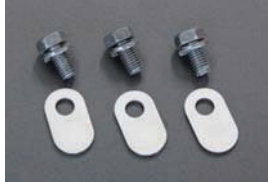
L6 カムホルダーオイルシャワープラグ ¥1,200/SET ・L型前期型エンジンにセンター給油カムを装着した時に必要なオイル通路柱。