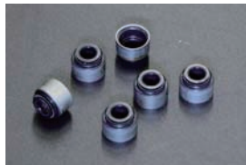
L型 ローヘッドバルブオイルシール ¥270/1ヶ 純正品より1.3mm高さが低いタイプ。底付きまでの距離をかせて、バルブリフトをあげられる。