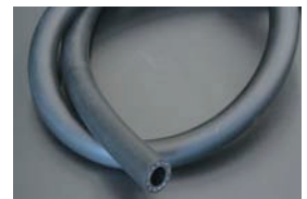
12φ耐圧耐油ゴムホース オイルクーラー等の高圧力に対応する耐油性ゴムホース ¥1,500/1m