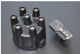
ディスクキャップ&ローターセット 純正フルトラディスクビ用 適合: S31, S130 (前期) GC111, GC210 価格: ¥5,560/SET