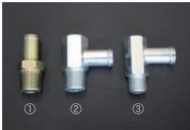
L型 ヘッドヒーターコネクタ ① L6用 16φストレート ¥600 ② L6用 16φL型 ¥1,520 ③ L4用 16φL型 ¥820