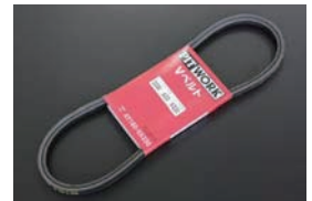
L型 ファンベルト (標準品) ・AY160-VA330 ¥950 ・AY160-VA335 ¥1,050 ・AY160-VA340 ¥1,050 ・AY160-VA345 ¥1,050