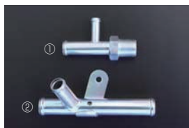
L6ブロック横ヒーターコネクタ ①16-10φコネクタ ¥1,920 ②19-16-19φコネクタ ¥750