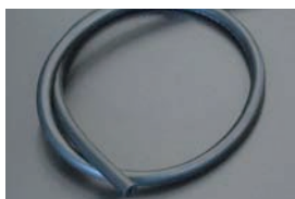
4mmバキュームホース ¥900/1m ブースト計やディスクビのバキューム等に使用できる。