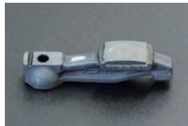
L型 日産純正ロッカーアーム ・L4 セット ¥23,920 ・L6 セット ¥35,880 ・単品 ¥2,990