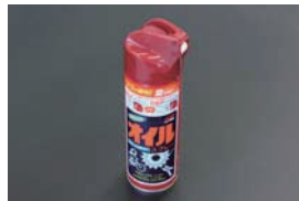
オイルスプレー (220ml) ¥800 カム、クランク、コンロッド、シリンダーなどの保管時の錆止めに便利なスプレー式オイル。