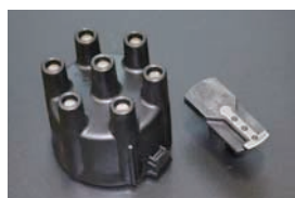
ディスクキャップ&ローターセット 純正フルトラディスクビ用 適合: S31, S130 (前期) GC111, GC210 価格: ¥5,560/SET