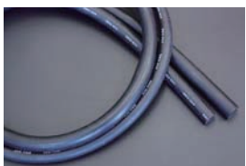
汎用ヒーターホース (肉厚4mm 長さ1m) ・内径16φヒーターホース ¥1,700 ・内径19φヒーターホース ¥2,000