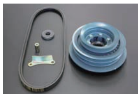
L6クーラー用ブリーキット ¥18,290/KIT