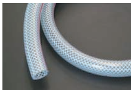
ブローバイホース 品番: 31D003 サイズ: 内径 15φ 外径 22φ 適合: L型, 2TG, 18RG 価格: ¥1,000/1m