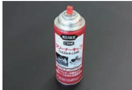
キャブクリーナー (420ml) ¥1,200 ソレックスやウエーバーの内部や外観の頑固な油污を簡単に落とせる強力クリーナー