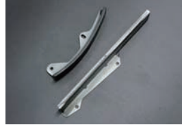
L型チェーンガイド ・曲り ¥1,920 ・ストレート ¥800