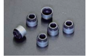
L型 ローヘッドバルブオイルシール ¥270/1ヶ 純正品より 1.3mm 高さが低いタイプ。底付きまでの距離をかせて、バルブリフトをあげられる。