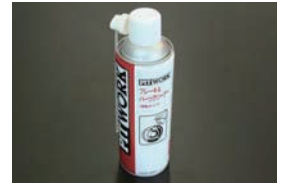
日産純正パーツクリーナー (480ml) ¥1,300 エンジンパーツやブレーキ回りの洗浄に最適。速乾タイプなのでパーツに水滴が付きづらい。