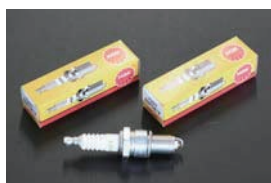
NGK グリーンプラグ ・ならし運転や街乗り用プラグ 品番: BP4EY~BP6EY 適合: L型, A型, U20, 2TG, 18RG, 4K 価格: ¥430