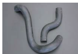
S30 後期/S31 ラジエーターホース (S49.10~) ・アッパーホース ¥1,990~¥2,500 ・ロアホース ¥2,920~¥3,500