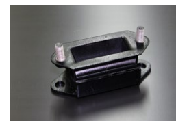
SR311 強化ミッションマント 適合：フェアレディー U20用 価格： ¥12,000