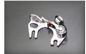
日産旧車用 ポイント 適 合：L用、A型、U20、G7 価 格：¥570