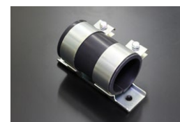
フューエルポンプブラケット 適合：BOCSH 52φポンプ用 価格： ¥2,500