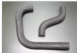
GC10 網目ラジエーターホース 原動機：L20 適 合：GC10/KGC10 価 格：アッパーホース¥3,000 ロアホース ¥4,000