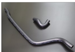
HR30 ヒーターホースSET 原動機：L20 適 合：HR30 価 格：¥4,000 /セット