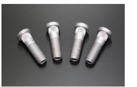
5mmロングハブボルト サイズ：首下42mm ネジ長27mm 適 合：日産旧車用 価 格：¥230/1本