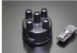
A12ディスクキャップ&ローター 原動機：A12 適 合：B110サニー サントラ (S50.10~S61.2) 価 格：¥5,170/セット