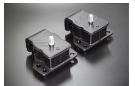
510 日産純正エンジンマウント 原動機：L14、L16、L18 適 合：510ブルーバード 価 格：¥6,500/SET