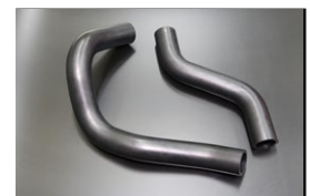
G610サメブル ラジエーターホース 原動機：L20 適 合：610ブルーバード 価 格：アッパーホース¥2,500 ロアホース ¥3,500