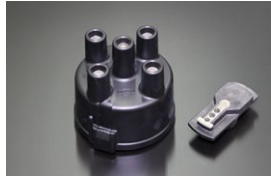
U20ディスクキャップ&ローター 原動機：U20 適 合：SR311 価 格：¥5,170/セット