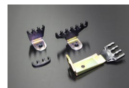
L6 プラグコードホルダーセット (スタンダード) 適合：支柱は2本ボルトサーモカーパー用 価格： ¥7,000/set