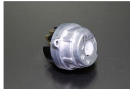
日産旧車用キースイッチ 適 合：ACC付きの日産旧車用 ※KPGC10は不適合 価 格：¥3,490