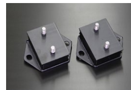
SR311 U20エンジンマウント 仕様：日産純正部品 価格： ¥3,460/SET