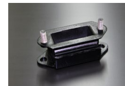
SP311 強化ミッションマント 適合：フェアレディー R型1600cc用 価格： ¥12,000