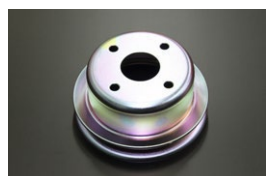
L6用 純正ウォーターポンププリー 原動機：L20~L28 適 合：外径116φ 13mmベルト用 価 格：¥4,630