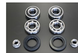
リヤハブベアリング オーバーホールキット 適 合：S30/S31 価 格：¥2,1480/左右セット