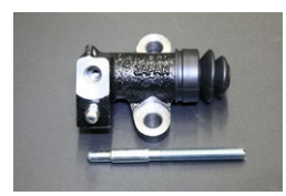
手動調整式リリーズシリンダー サイズ：3/4 適 合：GC10/S30(前期) 価 格：¥8,160