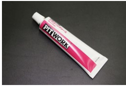
日産 シリコングリス ホイルシリンダーキャップゴム等の シールや潤滑などに使用 価 格：¥2,700