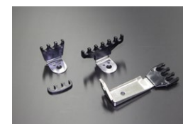
L6 プラグコードホルダーセット (クロームメッキ) 適合：支柱は2本ボルトサーモカーパー用 価格： ¥8,000/set