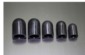
水回り対応 ゴムキャップ 19φ：¥450 12φ：¥400 16φ：¥450 10φ：¥300 14φ：¥400 ※耐熱温度 200° ※肉厚 10φ=2.0 12~19φ=3.0mm