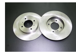
STDブレーキローターセット ・GC10 (F)：¥45,000/セット ・GC110 (F)：¥45,000/セット ・S130前期 (R)：¥45,000/セット ・S130後期 (R)：¥26,800/セット