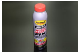
リスロン 超強力水漏れ修理剤 ヘッドガスケットフィックス ※ヘッドガスケットからの水漏れを 高い確率で永久的に治せる修理剤 価 格：¥11,670