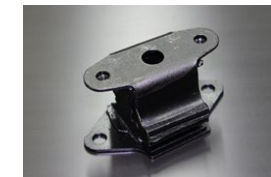
510強化ミッションマウント 原動機：L14、L16、L18 適 合：510ブルーバード 価 格：¥10,000