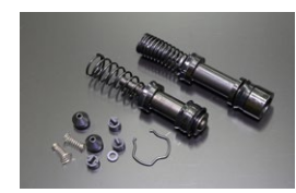
ブレーキマスター シールキット 適合：ナブコ 7/8 価 格：¥8,130