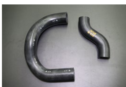
510ラジエーターホース 原動機：L14、L16、L18 適 合：510ブルーバード 価 格：アッパーホース¥1,370 ロアホース ¥2,370