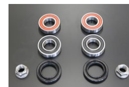
リヤハブベアリング オーバーホールキット 適 合：510 価 格：¥5,980/左右セット