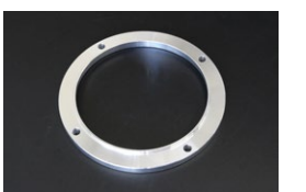
L6用 カップリングファンスペーサー ※ファンを前方に8mmオフセットさせるパーツ ・厚み...8mm ・付属品...ロングボルト4本 ・価格： ¥4,600