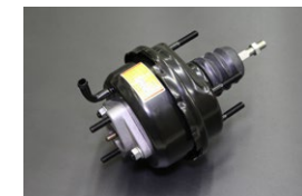
GC110前期マスターパック サイズ：外径143φ (ツメ部) ※スパーサー使用でハコスカ流用可 価 格：¥20,600