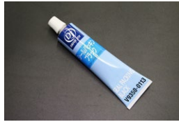
トヨタ シールパッキングブラック エンジンの組み立て用に使用できる液体 ガスケットで乾燥後は耐熱、耐油に優れた ゴム状の弾性被膜を形成する 価 格：¥2,840