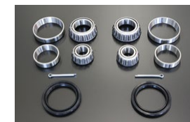
フロントハブベアリング オーバーホールキット 適 合：GC10/GC110/GC210 S30/S130 価 格：¥13,160/左右セット