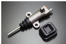
手動調整 3/4レリーズシリンダー 適合：SR311/SP311 (後期) 価格：¥9,220 (パーツ別) ●クラッチフォークブーツ ¥2,500 (5速MT用)