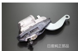
13/16標準ホイールシリンダー 適合：GC10、GC110、510 価格： ¥22,900/1ヶ ¥23,400/1ヶ