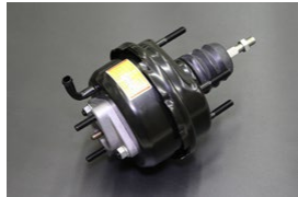
GC110前期マスターバック サイズ：外径143φ (ツメ部) ※スペーサー使用でハコスカ流用可 価格： ¥20,000 ¥21,000