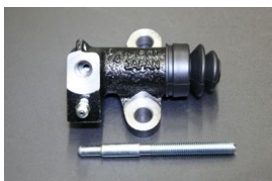
手動調整 3/4レリーズシリンダー 適合：GC10/S30前期 価格：¥8,160