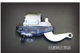
7/8大容量ホイールシリンダー 適合：GC10、GC110、510 価格： ¥22,900/1ヶ ¥23,400/1ヶ