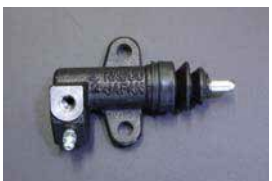
L型 3/4 レリーズシリンダー Assy 品番：30620-U7001 サイズ：3/4 適合：L型全車 (自動調整タイプ) 価格：¥5,030