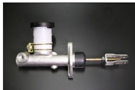
5/8クラッチマスターシリンダー 適合：SR311 SP311 サイズ：5/8 価格：¥17,000