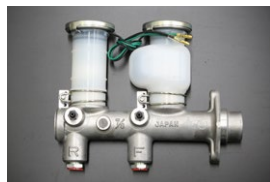
GC210 ブレーキマスターシリンダー サイズ：7/8 (日産純正ナブコ製) 適合：リヤドラム車 (L20E) 価格：¥38,800