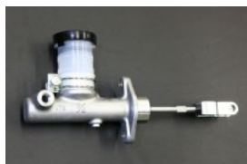
5/8クラッチマスターシリンダー (汎用タイプ) 適合：S30、GC110、C130 価格：¥12,200