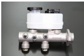
S130 ブレーキマスターシリンダー サイズ：15/16 適合：81.10~83.8 (L20ET) 価格：¥31,900