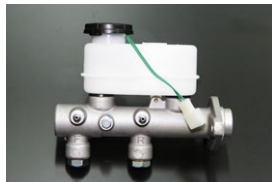
S130 ブレーキマスターシリンダー サイズ：15/16 適合：81.10~83.8 (L20E) 81.10~83.8 (L28E) 価格：¥35,000