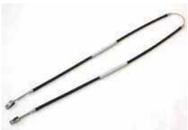
S30 前期サイドブレーキワイヤー

適合: S30 後期, S31 年式: S51.5~ 材質: フェロド AM4 価格: ¥6,000/1台 ※箱に汚れありご了承ください。