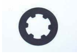
R180 LSD フリクションディスク

①ピニオンオイルシール ¥670 ②サイドオイルシール ¥920/1ヶ ③デフカバーパッキン ¥1,150 ¥1,170