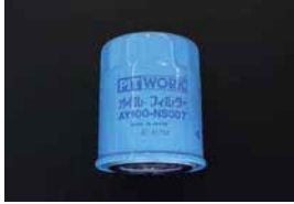
オイルフィルター

品番: AY100-NS008 適応: L20~L28 L14~L18 Z18, Z20, FJ20 価格: ¥1,450