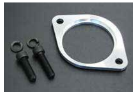
L型 セルモータースペーサー

後期用ビックサイズです。(162φ) 前期に付けば制動力アップ。 ¥29,200 ¥24,900 ¥41,400 ¥42,200