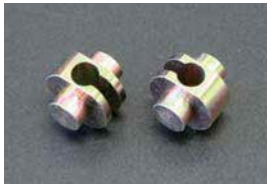
サイドブレーキワイヤー止めゴマ

・18RG ¥3,250 ・2TG前期 ¥2,100 ・4AG ¥3,250 ・2TG後期 ¥3,250