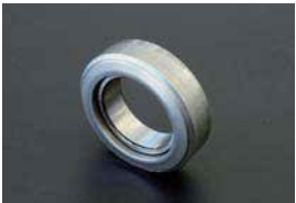
トヨタクラッチリリースベアリング

・18RG ¥3,250 ・2TG前期 ¥2,100 ・4AG ¥3,250 ・2TG後期 ¥3,250