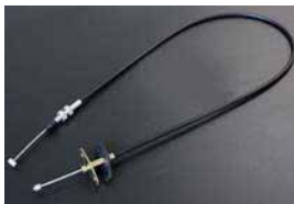
GC10/GC110 アクセルワイヤー