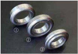
日産クラッチリリースベアリング

・サークリップ式のデフをボルトタイプに 変換して GC10 や S30 に使用するため のパーツ。 ¥6,000/1SET