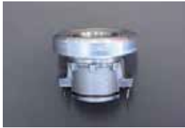
L型 スリーブ&ベアリングセット

①S20 ¥3,450 ②L型, FJ20, A型 ¥1,850 ③OS ツイン&トリプル用 ¥2,890