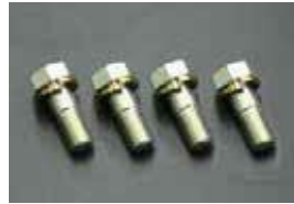
MK63 キャリパー取り付けボルト

①フロントオイルシール ¥270 ②リアオイルシール ¥420 ③フロントカバーパッキン ¥920 ④71C シフトハウジングパッキン ¥440 (パッキンはR32タイプMとシルビア用あり)