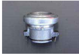
L型 スリーブ&ベアリングセット

適応: ニスモ強化クラッチ サイズ: 28mm スリーブ 厚み: 1.85mm 価格: ¥3,910