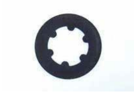
R200 LSD フリクションディスク

①ピニオンオイルシール ¥960 ②サイドオイルシール ¥380/1ヶ ③デフカバーパッキン ¥1,150 ¥1,170