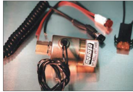
ラインロック本体