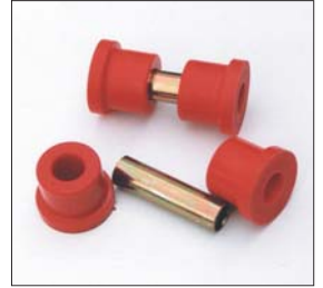
S30ミッションクロスメンバーSET