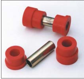
S30ロアアームブッシュSET