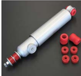
GC10リアショックブッシュSET