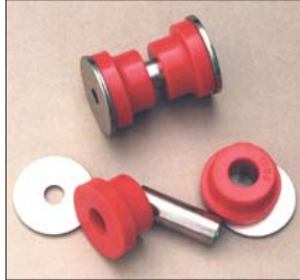
S30デフキャリアブッシュSET