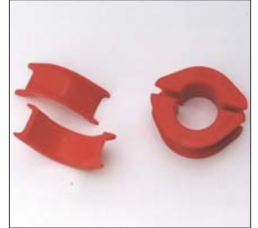
S30ラックアンドピニオンブッシュSET