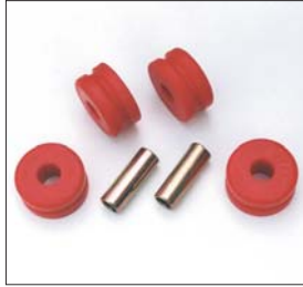
S30テンションロッドブッシュSET