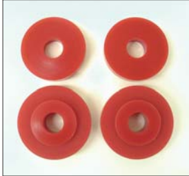
GC10ミッションクロスメンバーSET