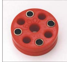
S30, S130ステアリングダンパー