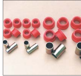
S30リアコントロールアームブッシュSET