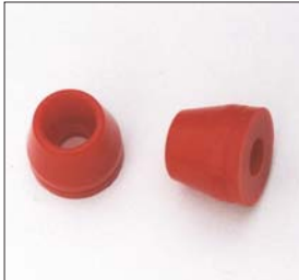
汎用FショックパンブストップSET