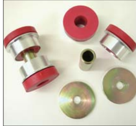
GC10デフキャリアブッシュSET