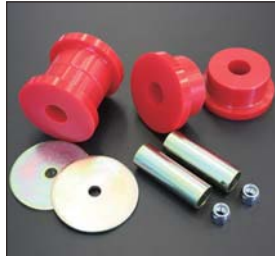
510, G610リアメンバーブッシュSET