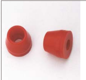
汎用FショックパンブストップSET