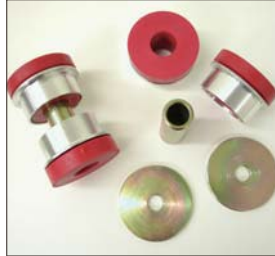
GC10デフキャリアブッシュSET