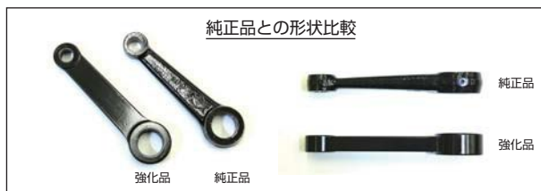
純正品との形状比較