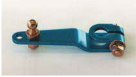
●アルミ押しレバー (軸径: 8φ 10φあり) 本体 ¥2,200 インマニキットに標準的に付属するスタンダード品 ※アルミニウム製品