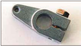
●押しレバー (軸径: 8φ 10φあり) 本体 ¥1,400 本体 ¥1,000 リターンスプリングの強さを調整するレバー。