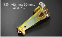
●強化押しレバー (軸径: 8φ 10φあり) 新製品 ボールジョイント無し ¥3,000 ボールジョイント付き ¥3,700 ゆるみやスレによるトラブルを解消できる。