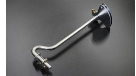
●ワイヤー式L6ジョイント ¥7,600 ワイヤーでL6ジョイントを駆動する車両に使用