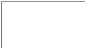
●インマニ用バキュームホースジョイント ・マスターバック用ホースジョイント (10.5φ-1/4) ¥600 ・バキューム計用ホースジョイント (4φ-1/8) ¥450