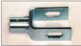
●コの字ジョイント 本体 ¥2,800 本体 ¥2,000 ステンパーのジョイントパーツ。(L4, L6用)