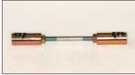
●ターンバックル (ゴールド) 本体 ¥2,600 本体 ¥2,000 ゴールドの部分はシンチユウ製でヒビ割れに強く脱着が簡単。