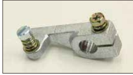
●調整レバー (軸径: 10φ) 本体 ¥1,500 押しレバーによるスロットル開度を微調整するときに必要。