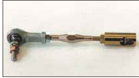
●ターンバックル (片ピロ) 本体 ¥3,100 ソレックスの場合はキャブ側のボールが外れないため片ピロタイプをおすすめ。