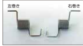
●リターンスプリング 本体 ¥600 スロットルの戻り側のスプリングでエンジン型式によって右巻きと左巻きがあり。