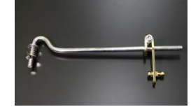
●L6 ジョイント (強化レバー付き) 新製品 本体 ¥8,500 激しいアクセルワークでもレバーが滑らない強化レバー付き