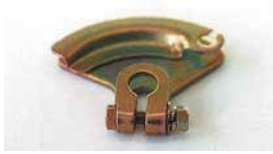
●オオギレバー (軸径: 8φ 10φあり) 本体 ¥2,800 本体 ¥1,900 ワイヤー式でスロットルを動作させるレバー。日産用、トヨタ用あり。