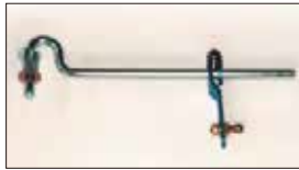
●L6ジョイント 本体 ¥7,000 本体 ¥5,000 L6ロッド式インマニの構成部品でリンクagesをロッドで駆動するためのジョイントパーツ。