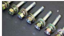
●インマニスタッドボルト 本体 ¥380/1本 ※ナット&ワッシャー付き