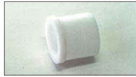
●テフロンブッシュ (軸径：10φ) 本体 ¥700 ステンパーの揺動部に使用。インマニ1台に2ヶ必要。(ブッシュ式インマニ用)