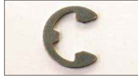
●リング (軸径：8φ 10φあり) 本体 ¥80 ステンパーのロックに使用。