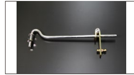
●L6 ジョイント (強化レバー付き) 新製品 本体 ¥8,500 激しいアクセルワークでもレバーが滑らない強化レバー付き