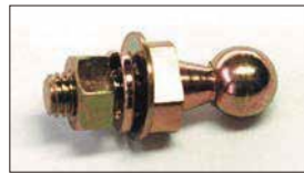
●ボールジョイント 本体 ¥700 本体 ¥500 押しレバーの先端に使用しているパーツ。