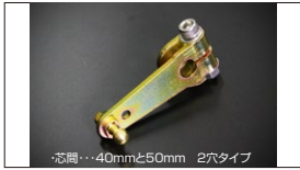
●強化押しレバー (軸径：8φ 10φあり) 新製品 ボールジョイント無し ¥3,000 ボールジョイント付き ¥3,700 ゆるみやスレによるトラブルを解消できる。