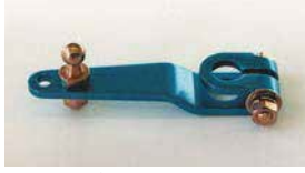
●アルミ押しレバー (軸径：8φ 10φあり) 本体 ¥2,200 インマニキットに標準的に付属するスタンダード品 ※アルミニウム製品