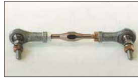
●ターンバックル (両ピロ) 本体 ¥3,600 ピロボールを使用することでガタを少なくできスポーツ走行で外れる心配も解消できる。