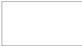
●インマニ用バキュームホースジョイント ・マスターバック用ジョイント (10.5φ-1/4) ¥600