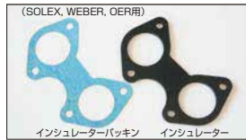
(SOLEX, WEBER, OER用) ●インシュレーターパッキン 40φ用 44φ用 50φ用 各 ¥300/1枚 ●インシュレーター 40φ用 44φ用 50φ用 各 ¥2,200/1枚 ¥2,500/1枚