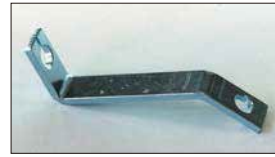
●L型用ワイヤー受け 本体 ¥1,200 ワイヤーを受け止めるためのブラケットでエンジン型式によって種類あり。