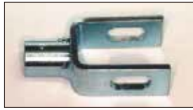
●コの字ジョイント 本体 ¥2,000 ステンパーのジョイントパーツ。(L4、L6用)