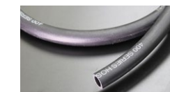
●内径11.5mm フューエルゴムホース (キャブ専用) 本体 ¥2,000/1m 本体 ¥1,000/0.5m