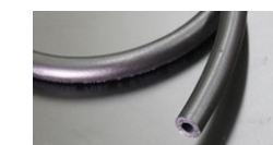
●内径8mm フューエルゴムホース (キャブ専用) 本体 ¥1,000/1m