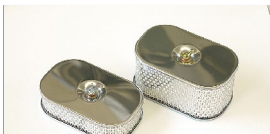
●エアークリーナー (SOLEX, WEBER, OER用) 45mm厚 本体 ¥4,500 80mm厚 本体 ¥4,900