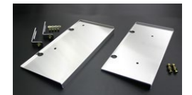
●アルミヒートプレート (つり下げタイプ)