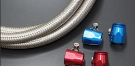
●ステンメッシュフューエルホース#6 1m 本体 ¥4,000