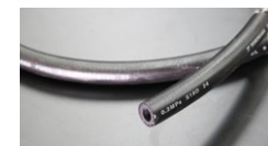
●内径9mm フューエルゴムホース (キャブ専用) 本体 ¥1,400/1m