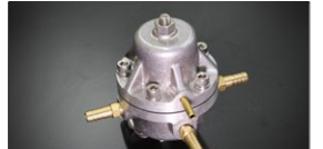
●大容量フューエルレギュレーター 本体 ¥16,000 *キャブの燃圧圧を調整及び安定させる為の必需品！メカポンプ及びインジェクションポンプに対応できる大容量タイプ。