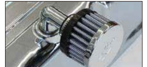
●グローブフィルター 本体 ¥4,800