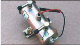
●ニスモ フューエルポンプ 本体 ¥11,500 *吐出量 1.3L/分 *最大吐出圧 0.45kg/cm 2 *キャブ専用の低燃圧タイプ、フューエルレギュレーターで圧力調整必要。