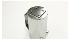
●コレクタータンク 上4下2ホースタイプ (円筒) 本体 ¥19,500