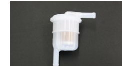
●汎用フューエルフィルター 本体 1,690