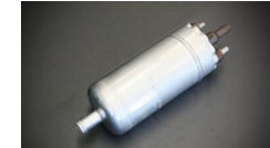
(入口12φ出口8φ 本体52φ全長180mm) ●2.6Lポッシュフューエルポンプ ¥28,600