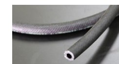
●内径8mm 高圧フューエルゴムホース (インジェクション専用) 本体 ¥1,500/1m