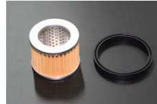
●交換用フィルター&パッキンセット ・ミツバ純正フューエルポンプ用 ¥1,300