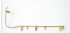
●L型3連フューエルパイプ 本体 ¥4,500