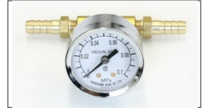
●40φ燃圧計 本体 ¥6,000 0~0.1MP (0~1kg/cm 2 ) エンジンルームに取り付け可能なキャブ専用燃圧計。 ※脈動による針振れ防止機能付き。