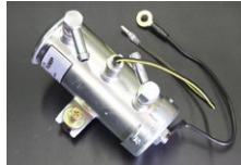
●ミツバタイプ フューエルポンプ ¥17,000 *吐出量 1.4L/分 *最大吐出圧 0.3kg/cm 2 *キャブ専用の低燃圧タイプ、フューエルレギュレーター無しで使用可。