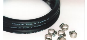
●8mm フューエルゴムホース 1m 本体 ¥1,000