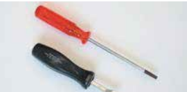
●ジェットブロックドライバー (SOLEX, WEBER共用) 本体 調整中