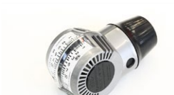
●キャブバルナー/エアフロタイプ 本体 ¥10,000