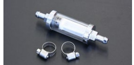
●マグネット付燃料フィルター 本体 ¥3,500