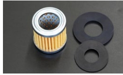
●交換用フィルター&パッキンセット ・ニスモフューエルポンプ用 ¥1,800 ・ミツバタイプフューエルポンプ用 ¥1,800