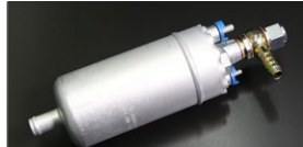
(入口12φ出口8φ 90度向き 52φ全長180mm) ●2.9Lポッシュフューエルポンプ ¥39,000