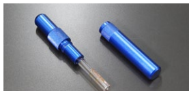
●油面ゲージ 本体 ¥4,800