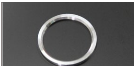
●WEBER40 ベンチュリー固定リング ファンネル用 本体 ¥1,000