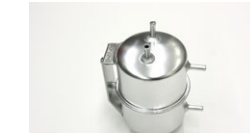
●コレクタータンク 下3下1ホースタイプ (円筒) 本体 ¥20,000