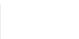
●日産純正 ワイヤ燃料ホースバンド