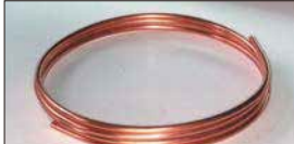
●8mm銅パイプ (3m巻き) 本体 ¥5,100 (4m巻き) 本体 ¥6,800