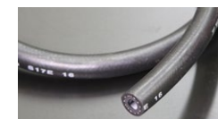
●内径8mm フューエルゴムホース (キャブ専用) 本体 ¥1,000/1m