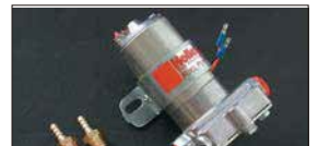
●HOLLYフューエルポンプ 本体 ¥35,000