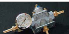
●燃圧計&レギュレーターセット 本体 ¥18,000