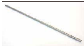
●ステンパー L6 1001用 本体 ¥3,800 本体 ¥3,000 L6 1002用 本体 ¥3,800 本体 ¥3,000 A型、L4, FJ20, Z20, 4K, 4AG 本体 ¥2,600 本体 ¥2,000