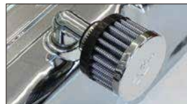
●ブローバイフィルター 本体 ¥2,900 適合: L型、A型、2TG、18RG地 ※16φ開口