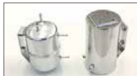
●コルクタンク 上3下1ホースロタイプ (円筒) 本体 ¥20,000 上4下2ホースロタイプ (円筒) 本体 ¥19,500 ※上4下2タイプは、ホース口別売です。