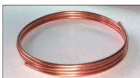
●8mm銅パイプ (3m巻き) 本体 ¥3,000 (4m巻き) 本体 ¥4,000 燃料配管用の銅パイプです。なまし材なので、しなやかに曲げられて便利。(1m ¥1,000単位で切り売り可)