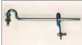
●L6ジョイント 本体 ¥7,000 本体 ¥5,000 L6ロッド式インマニの構成部品でリンクagesをロッドで駆動するためのジョイントパーツ。