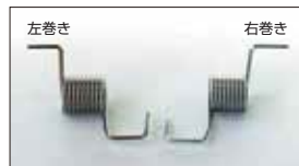
●リターンスプリング 本体 ¥600 スロットルの戻り側のスプリングでエンジン型式によって右巻きと左巻きがあり。