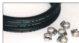
●8mmフューエルゴムホース 1m 本体 ¥1,000 ●ステンバンド 本体 ¥280