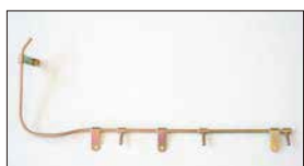
●H型3連フューエルパイプ 本体 ¥4,500