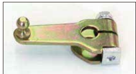
●強化タイプ押しレバー 販売終了 本体 ¥2,800 緩みやクラックに強いステンレス素材使用で耐久性抜群。 ※芯間距離40mm 軸径10φ用