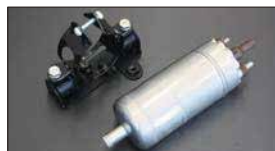
●ボッシュ大容量フューエルポンプ 本体 ¥30,000 ※吐出量 3.1L/分 (L30~L31向け) (入口12φ出口8φ 本体52φ全長180mm) ●フューエルポンプブラケット 本体 ¥1,790 本体 ¥1,830