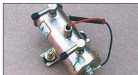
●ニスモ フューエルポンプ 本体 ¥11,500 ※吐出量 1.3L/分 ※最大吐出圧 0.45kg/cm 2 交換用フィルター&パッキンセット 本体 ¥1,800