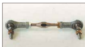
●ターンバックル (両ピロ) 本体 ¥3,600 ピロボールを使用することでガタを少なくできスポーツ走行で外れる心配も解消できる。