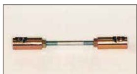
●ターンバックル (ゴールド) 本体 ¥2,600 本体 ¥2,000 ゴールドの部分はシンチウ製でヒビ割れに強い。