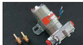
●HOLLYフューエルポンプ 本体 ¥19,800 本体 ¥23,500 ※吐出量 4226cc/分の大容量タイプ