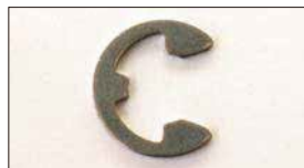
●Eリング (軸径: 8φ 10φあり) 本体 ¥80 ステンパーのロックに使用。