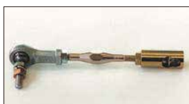
●ターンバックル (片ピロ) 本体 ¥3,100 ソレックスの場合はキャブ側のボールが外れないため片ピロタイプがとってでも簡単。