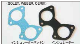
(SOLEX, WEBER, OER用) インシュレーターパッキン インシュレーター ●インシュレーターパッキン 40φ用 44φ用 50φ用 各 ¥300/1枚 ●インシュレーター 40φ用 44φ用 50φ用 各 ¥2,200/1枚 ¥2,500/1枚