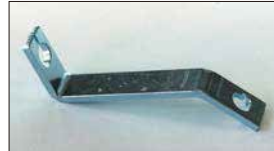
●L型用ワイヤー受け 本体 ¥1,200 ワイヤーを受け止めるためのブラケットでエンジン型式によって種類あり。