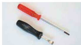
●ジェットブロックドライバー 本体 ¥5,500 (SOLEX, WEBER共用) 本体 ¥4,500 ●エアージェットドライバー (SOLEX用) 本体 ¥2,170 本体 ¥1,750