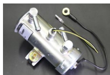
●ミツタイフューエルポンプ 本体 ¥13,500 ※吐出量 1.4L/分 ※最大吐出圧 0.3kg/cm 2 交換用フィルター&パッキンセット 本体 ¥1,800