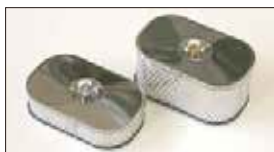
●エアークリーナー (SOLEX, WEBER, OER用) 45mm厚 本体 ¥3,800 80mm厚 本体 ¥4,400 ●交換用フィルター 45mm ¥1,800/80mm ¥2,400 ●交換用エアークリーナーパッキン 本体 ¥200