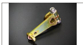
●強化押しレバー (軸径: 8φ 10φあり) 新製品 ボールジョイント無し ¥3,000 ボールジョイント付き ¥3,700 ゆるみやスレによるトラブルを解消できる。