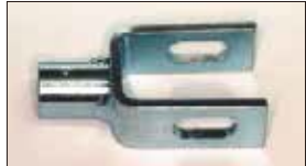
●コの字ジョイント 本体 ¥2,000 ステンパーのジョイントパーツ。(L4, L6用)