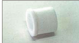
●テフロンブッシュ (軸径: 10φ) 本体 ¥700 ステンパーの摺動部に使用。インマニ1台に2ヶ必要。(ブッシュ式インマニ用)