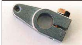
●戻しレバー (軸径: 8φ 10φあり) 本体 ¥1,400 本体 ¥1,000 リターンスプリングの強さを調整するレバー。