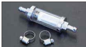
●マグネット付燃料フィルター 本体 ¥3,500 ※分解清掃可能なガス管タイプのフィルターで、内部に仕込まれたマグネットが砂や鉄粉をキャッチします。 (ホースバンド2個付属)