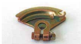
●オオギレバー (軸径: 8φ 10φあり) 本体 ¥2,500 本体 ¥1,900 ワイヤー式でスロットルを作動させるレバー。日産用、トヨタ用あり。