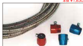
●ステンメッシュフューエルホース#6 1m 本体 ¥5,000 ●アールズエコノバンド#6 本体 ¥850