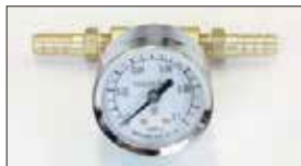
●40φ燃圧計 本体 ¥5,000 0~0.1MP (0~1kg/cm 2 ) エンジンルームに取り付け可能なキャブ専用燃圧計。 ※脈動による針振れ防止機能付き。