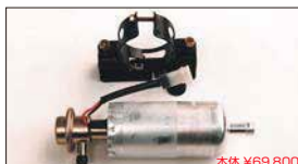
●大容量フューエルポンプ 本体 ¥69,800 本体 ¥36,300 ※吐出量 2.2L/分 (入口12φ出口8φ 本体54φ) ●フューエルポンプブラケット 本体 ¥1,790 本体 ¥1,830