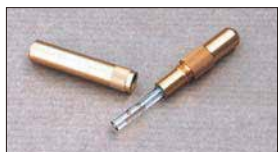
●油面ゲージ 本体 ¥4,500 ※SOLEX, WEBER, OERキャブに使用できる。 簡単ワンタッチ、ガラス管タイプ!