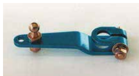
●アルミ押しレバー (軸径: 8φ 10φあり) 本体 ¥2,200 インマニキットに標準的に付属するスタンダード品 ※アルミニウム製品