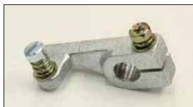
●調整レバー (軸径: 10φ) 本体 ¥1,500 押しレバーによるスロットル開度を調整するときに必要。