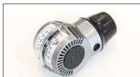
●キャブバルancer/エアフロタイプ 本体 ¥10,000 適合: SOLEX40~50 WEBER40~48 DER40~50φ キャブに当てたままでもアイドリングが下がる 新しい新機構で簡単にキャブ調整ができます。