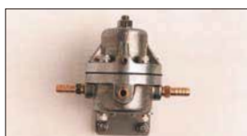
●大容量フューエルレギュレーター 本体 ¥16,000 ※キャブの燃料圧を調整及び安定させる為の必需品! メカポンプ及びインジェクションポンプに対応できる 大容量タイプ。