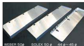
●L6 アルミヒートプレート (組み込みタイプ) SOLEX, WEBER, OER 40φ~45φ 本体 ¥5,500 ●L6 アルミヒートプレート (つり下げタイプ) SOLEX 44, 50φ ※金具付き 本体 ¥7,000 WEBER 50φ ※金具付き 本体 ¥6,000 L4 SOLEX/OER用 ※金具付き ¥6,200 L4 WEBER用 ※金具付き ¥5,500 A型 K型 SOLEX/OER用 ※金具付き ¥6,200 A型 K型 WEBER用 ※金具付き ¥5,500