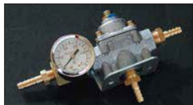
●燃圧計&レギュレーターセット 本体 ¥15,000 デュアル出口のリターン無しタイプ。 ・HOLLY レギュレーターのみ 本体 ¥12,000