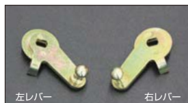
●WEBER 標準スロットルレバー 適合: WEBER 40~45φ ・スロットル右レバー 本体 ¥5,000 ・スロットル左レバー 本体 ¥5,000