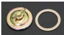
●WEBER ジェットカバー 適合: WEBER 40~65φ ・ジェットカバー 本体 ¥3,500 ・ジェットカバーパッキン 本体 ¥350