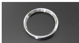
●WEBER40 ベンチュリー固定リング エアクリ用 本体 ¥1,000

社外品のファンネルを装着した際に発生するインナーベンチュリーとファンネルとの隙間を無くし、同時にベンチュリーをしっかりと固定します。(ファンネル固定タブが別途必要)