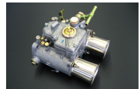
●WEBER48φキャブレター 48DCO/SP 本体 ¥135,000 /1基 ※フューエルバルブ付属 (横T.縦T.L.S) 標準左レバー付 (右レバー対応可)