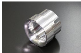
●WEBER 45φアウターベンチュリー (ジュラルミン製) ¥4,000 (32φ 34φ 36φ 38φ 40φ) ※DCOE9用とDCOE152用あり