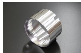
●WEBER 50φアウターベンチュリー (ジュラルミン製) ¥5,000 (39φ 41φ 43φ 46φ)