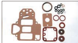
●WEBER パッキンセット 本体 ¥4,300 ※型により形状に種類あり