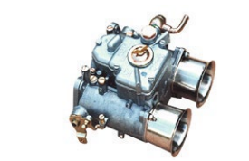
●WEBER50φキャブレター 50DCO/SP 本体 ¥160,000 /1基 ※フューエルバルブ付属 (横T.縦T.L.S) 標準左レバー付