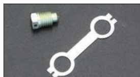
●WEBER ベンチュリーストッパーボルト 適合: WEBER 40~50φ ・ベンチュリーストッパーボルト 本体 ¥1,200 ・ロックワッシャー 本体 ¥1,400