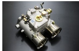
●WEBER55φキャブレター 55DCO/SP 本体 ¥170,000 /1基 ※フューエルバルブ付属 (横T.縦T.L.S) 右レバー、左レバータイプあり (画像は右レバー)