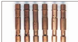
●WEBER エマルジョンチューブ F4 本体 ¥4,500 F2 本体 ¥3,500 F7 本体 ¥4,500 F9 本体 ¥3,500 F11 本体 ¥3,500 F16 本体 ¥3,500