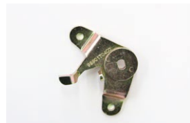
●WEBER50φ 左スロットルレバー ・ボールジョイント無し 本体 ¥4,300 ・ボールジョイント付き 本体 ¥5,000