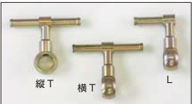
●WEBER フューエルバルブ Lタイプ 本体 ¥3,500 (横向き) Tタイプ 本体 ¥3,500 (縦向き) Tタイプ 本体 ¥3,500