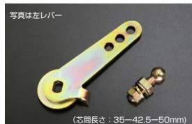
●WEBER40~45φ 調整式スロットルレバー (右レバー/左レバーあり) ・ボールジョイント無し 本体 ¥3,200 ・ボールジョイント付き 本体 ¥3,900