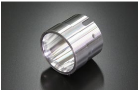
●WEBER 40φアウターベンチュリー (ジュラルミン製) ¥4,000 (32φ 34φ 36φ)