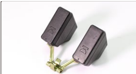
●WEBER フロート プラスチックフロート 本体 ¥9,800