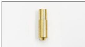
●WEBER ジェット F11 スロージェット#40~#70(#5とび) 本体 ¥600 F8 スロージェット#40~#70(#5とび) 本体 ¥600 F9 スロージェット#40~#70(#5とび) 本体 ¥600 F13 スロージェット#45~#65(#5とび) 本体 ¥800