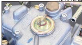
●WEBER ステンレスボルトセット 本体 ¥1,000 適合: WEBER 40~50φ 5本SET (L=20mm×1 L=25mm×4)