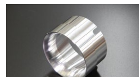
●WEBER 50φ アウターベンチュリー (ジュラルミン製) ¥5,000 (39φ 41φ 43φ 46φ)