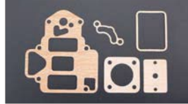
●OER/パッキンセット 45φ 本体 ¥1,400 47φ 本体 ¥1,400 50φ 本体 ¥1,400