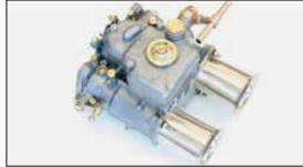
●WEBER45φキャブレター 45DCOE-152 本体 ¥73,000 /1基 45DCOE-9 本体 ¥90,000 /1基