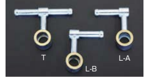
●OERフューエルパイプ 40φ~50φ T型 ¥3,200 L-A/L-B型 ¥3,300