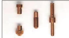
●WEBER ジェット メインジェット 本体 ¥600 エアージェット 本体 ¥600 スロージェット 本体 ¥700 ポンプノズル 本体 ¥1,600