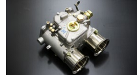
●WEBER65φキャブレター 本体 ¥120,000 /1基 ※右レバー、左レバータイプあり