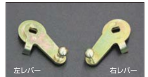
●WEBER 標準スロットルレバー 適合: WEBER 40~45φ ・スロットル右レバー 本体 ¥3,800 ・スロットル左レバー 本体 ¥3,800