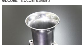
●WEBER 45φ 75mmエアーフアンネル (SOLEX汎用品) 本体 ¥5,800