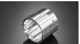
●WEBER 40φ アウターベンチュリー (ジュラルミン製) ¥4,000 (32φ 34φ φ36)