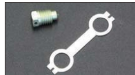
●WEBER ベンチュリーストッパーボルト 適合: WEBER 40~50φ ・ベンチュリーストッパーボルト 本体 ¥1,000 ・ロックワッシャー 本体 ¥1,200