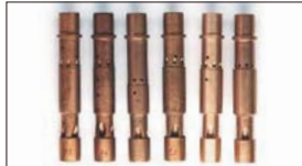
●WEBER エマルジョンチューブ F2 本体 ¥3,100 F4 本体 ¥3,100 F7 本体 ¥3,100 F9 本体 ¥3,100 F11 本体 ¥3,100 F16 本体 ¥3,100