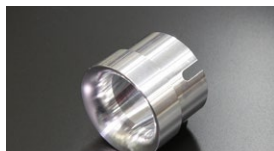
●WEBER 45φ アウターベンチュリー (ジュラルミン製) ¥4,000 (32φ 34φ φ36 38φ 40φ) ※DCOE9用とDCOE152用あり