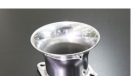
●WEBER 45φ 50mmエアーフアンネル (SOLEX汎用品) 本体 ¥3,800