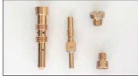
●OERジェット メインジェット 本体 ¥480 エアージェット 本体 ¥480 パイロットジェット 本体 ¥500 ポンプノズル 本体 ¥650