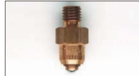
●WEBER ニードルバルブ #175 本体 ¥3,500 #200 本体 ¥3,500 #225 本体 ¥3,500 #250 本体 ¥3,500