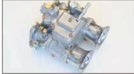
●OERキャブレター 45φ 本体 ¥49,000 47φ 本体 ¥63,000 50φ 本体 ¥86,000 (WEBERジェットタイプ) 45φ 本体 ¥52,000 (WEBERジェットタイプ) 47φ 本体 ¥56,000