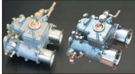
●WEBERキャブレター 40φ 本体 ¥73,000 /1基 48φ 本体 ¥95,000 /1基 50φ 本体 ¥109,000 /1基