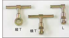
●WEBER フューエルパイプ Lタイプ 本体 ¥3,500 (横向き) Tタイプ 本体 ¥3,500 (縦向き) Tタイプ 本体 ¥3,500