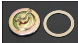
●WEBER ジェットカバー 適合: WEBER 40~50φ ・ジェットカバー 本体 ¥3,200 ・ジェットカバーパッキン 本体 ¥300