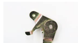
●WEBER50φ 左スロットルレバー ・ボールジョイント無し 本体 ¥3,000 ・ボールジョイント付き 本体 ¥3,700