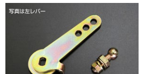
●WEBER40~45φ 調整式スロットルレバー (右レバー/左レバーあり) ・ボールジョイント無し 本体 ¥3,200 ・ボールジョイント付き 本体 ¥3,900 (芯間長さ: 35~42.5~50mm)