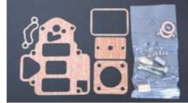
●OERリペアキット 45φ 本体 ¥5,800 47φ 本体 ¥5,800 50φ 本体 ¥5,800