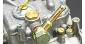
●WEBER フューエルパイプ ストレートパイプ 本体 ¥3,500