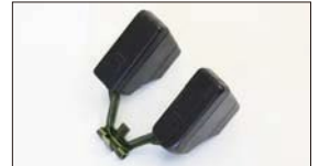
●WEBER フロート プラスチックフロート 本体 ¥8,500