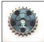
FJ20 E (T)