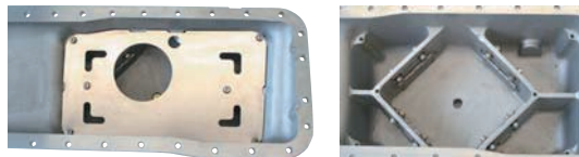
4方バツフルプレート

※附属のオイルストレーナーは標準品です。 強化タイプのオイルストレーナーを附属する場合は¥5,000 増しになります。