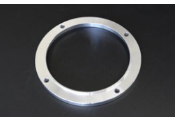
L6用 カップリングファンスペーサー ※ファンを前方に8mmオフセットさせるパーツ ・厚み...8mm ・付属品...ロングボルト4本 ・価格：¥4,600