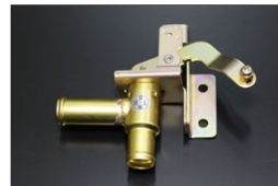
S30前期ヒーターコック 適合：1969/10~1973/9 価格：¥17,700