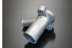
L型 19φウォーターインレット (ヒーターホース口 19φ) ※S48~S50年のS30,GC110,C130 等に標準的に使用されるタイプ。 価格：¥1,220