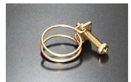
16φヒーターホース用ワイヤークランプ 当時の仕様 (復刻品) 適合：L型全車、他 価格：¥650 ※クロメートメッキ、+丸頭ボルト