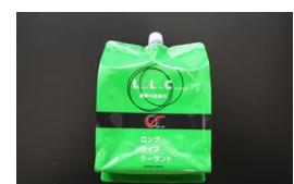
日産純正 ロングライフクーラント 適合：全車 容量：2リットル (色：グリーン) 価格：¥2,100