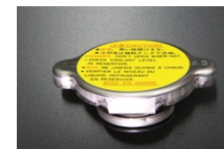
日産純正 ラジエーターキャップ 適合：GC10,GC110,GC210 C130,S30,S130 価格：¥2,690