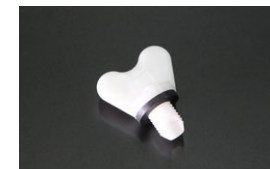
日産純正 ラジエータードレンコック 適合：S30~S130, GC10~R30 B110~B310, KHC130 他 価格：¥590