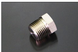
L型 1/2シリンダープラグ 原動機：L20,L24,L26,L28 適合：シリンダーブロック及びヘッド 価格：¥850 ※ネジ直径 20.9 (ステンレス製)