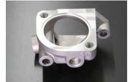
L型 STD サーモハウジング 適合：ファンキャブ、SUキャブ車 車種：S30,GC10,GC110,KHC130 価格：¥2,770 ※1/4サイズの水の取り出し口あり