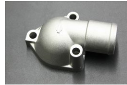
純正 L型サーモカバー(3本ボルト) 適合：L型 車種：S130,GC210等 価格：¥1,520