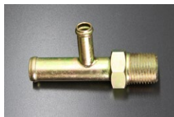
L6用 16-10 ヒーターコネクター ※S50年8月以降のS30後期、S31 等に標準的に使用されるタイプ。 (ウォーターインレットに取付けるパーツ) 復刻品 価格：¥5,000