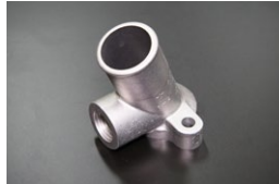
L型 1/2ウォーターインレット (コネクター取付部ねじ式) ※S50年8月以降のS30後期、S31 等に標準的に使用されるタイプ。 価格：¥4,640