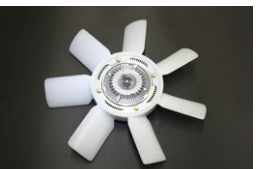
L6 カップリング+ファンセット 仕様：385mm 7枚羽 適合：L型全車 価格：¥31,950/SET (カップリング¥22,800 ファン¥9,150)