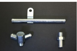
TE27 2TG用 ヒーターコネクター 14-17φ二又 ¥4,800 ヒーターパイプ 14φストレート ¥4,600 ヒーターコネクター 14φ-3/8 ¥1,500