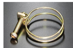
ラジエーターホース用ワイヤークランプ 当時の仕様 (復刻品) 適合：L型全車、他 (36φホース用) 価格：¥850 ※クロメートメッキ、+丸頭ボルト