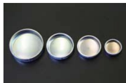
シリンダーブロック ツバ付きプラグ 50φ ¥250 40φ ¥250 35φ ¥250 25φ ¥250