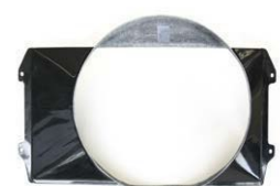
S30 FRPファンシュラウド 年式：S44.10~S49.9 適合：S30/HS30 価格：¥20,000