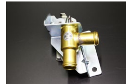
GC10後期ヒーターコック 適合： 価格：¥17,700