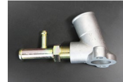
L型 16-10ウォーターインレットSET (コネクター取付部ねじ式) ※S50年8月以降のS30後期、S31 等に標準的に使用されるタイプ。 価格：¥9,640/SET