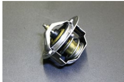
純正 サーモスタット 76.5度 適合：L型,FJ20,A型,S20,U20 価格：¥1,820