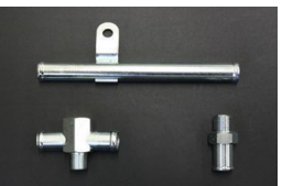
TA22/TA17 2TG用 ヒーターコネクター 17-17φ二又 ¥4,800 ヒーターパイプ 17φストレート ¥4,600 ヒーターコネクター 17φ-3/8 ¥1,500