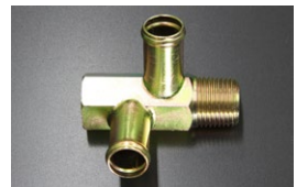
S130Z用 ヘッドヒーターコネクター (16φ二又-ネジサイズ1/2 ネジ径20.9) 復刻品 価格：¥6,000