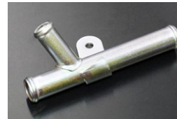
L6用 19-16-19ヒーターコネクター (ブロックサイドに取付けるパーツ) 価格：¥890