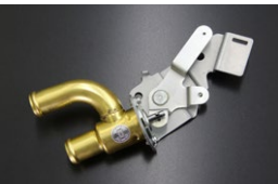
S130ヒーターコック 適合：S130全年度適合 (Z-T及オートエアコン車不可) 価格：¥17,700