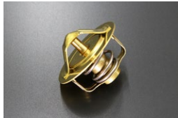
純正 サーモスタット 82度 適合：L型,FJ20,A型,S20,U20 価格：¥1,580