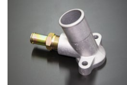
L型 16φウォーターインレットSET (コネクター取付部ねじ式) ※ダイレクトにヒーターホースをつなげ たい時に使用。 価格：¥5,340/SET