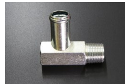
L4用 16φ-L型 ヘッドヒーターコネクター (ネジサイズ 3/8 ネジ径16.6) 価格：¥960