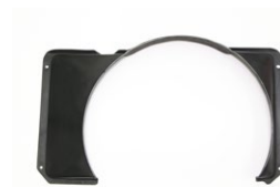
510 FRPファンシュラウド 年式： 適合：510全車 価格：¥15,000