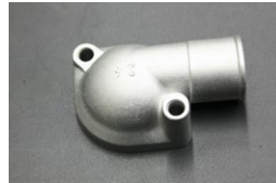
純正 L型サーモカバー(2本ボルト) 適合：L型 車種：S30,GC10等 価格：¥2,250