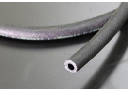
内径8mm フューエルゴムホース (高圧対応/インジェクション車用) 本体 ¥1,500/1m