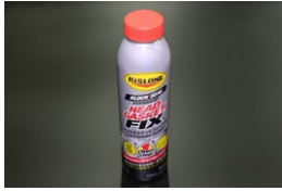
リスロン 超強力水漏れ修理剤 ヘッドガスケットフィックス ※ヘッドガスケットからの水漏れを 高い確率で永久的に治せる修理剤 価格：¥11,670