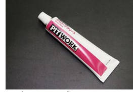
日産 シリコングリース オイルシリンダーキャップゴム等の シールや潤滑などに使用 価格：¥3,000