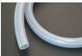
ブローバイホース 品番：31D003 サイズ：内径 15φ 外径 22φ 適合：L型, 2TG, 18RG 価格：¥1,000/1m