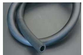
12φ 耐圧耐油ゴムホース オイルクーラー等の高圧力に対応する 耐油性ゴムホース ¥1,500/1m