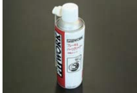
日産純正パーツクリーナー (480ml) ¥1,300 エンジンパーツやブレーキ回りの洗浄に最適。 速乾タイプなのでパーツに水滴が付きづらい。