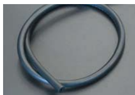
4mm バキュームホース ¥1,300/1m ブースト計やディスプレイのバキューム等に 使用できる。