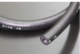
内径6mm フューエルゴムホース (キャブ車用) 本体 ¥1,000/1m