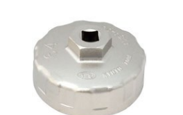
カップ型オイルフィルターレンチ 品番：AVSA-064 適合：3K, 4K, 4AG, 3SG 価格：¥2,680 ※フィルター直径 65φ