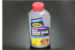
リスロン 超強力オイル漏れ修理剤 メインシールリペア ※クラクシールからのオイル漏れを 高い確率で治せるゴムシール専用修理剤 価格：¥3,080