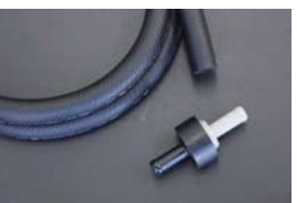
マスターバックホース&チェックバルブ 汎用チェックバルブ ¥3,910 汎用マスターバックホース ¥4,610 (内径 9mm×1.5M)