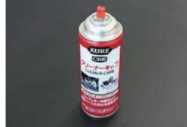
キャブクリーナー (420ml) ¥1,200 ソレックスやウエーバーの内部や外観 の頑固な油汚れを簡単に落とせる強力 クリーナー