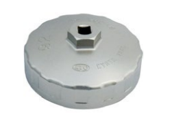
カップ型オイルフィルターレンチ 品番：AVSA-092 適合：L20~L28, FJ20 価格：¥3,210 ※フィルター直径 93φ