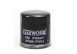
オイルフィルター 品番：AY100-TY013 適合：3K, 4K, 5K 価格：¥1,050