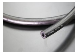
内径9mm フューエルゴムホース (キャブ車用) 本体 ¥1,400/1m