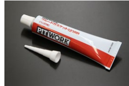
日産 シールパッキン ベンガラ エンジン、ミッション、デフの組み立て用 に使用できる液体ガスケット。 塗布後約5分ぐらいで固まりはじめる 価格：¥2,900