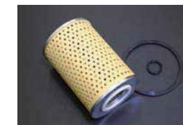
オイルフィルター 品番：15208-78525 適合：G20, G7 価格：¥1,310