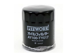
オイルフィルター 品番：AY100-TY017 適合：18RG 価格：¥1,260