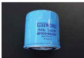
オイルフィルター 品番：AY100-NS008 適合：L20~L28 L14~L18 Z18, Z20, FJ20 価格：¥1,450