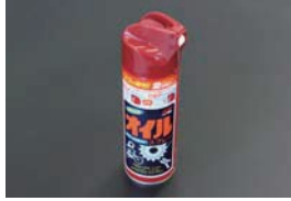
オイルスプレー (220ml) ¥800 カム、クラクシール、コンロッド、 シリンダーなどの保管時の錆止めに便利な スプレー式オイル。