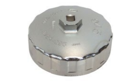
カップ型オイルフィルターレンチ 品番：AVSA-095 適合：2TG, 3TG, 2T, 3T 価格：¥3,210 ※フィルター直径 95.5φ