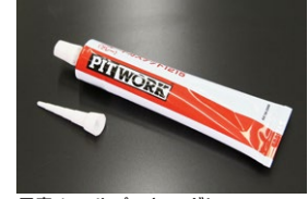
日産 シールパッキン グレー エンジン、ミッション、デフの組み立て用 に使用できる液体ガスケット。 塗布後約30分ぐらいで固まりはじめる 価格：¥3,200