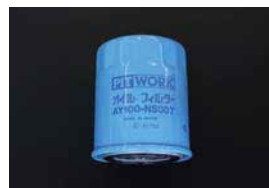
オイルフィルター 品番：AY100-NS007 適合：A12~A15, U20, H20 価格：¥1,150