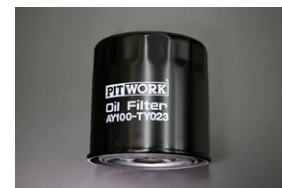
オイルフィルター 品番：AY100-TY023 適合：2TG, 3TG, 2T, 3T 価格：¥1,400