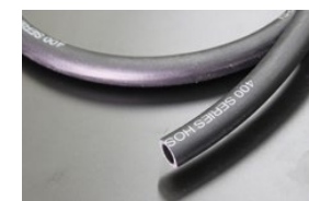
内径11.5mm フューエルゴムホース (キャブ車用) 本体 ¥2,400/1m 本体 ¥1,200/0.5m