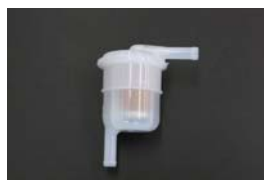
汎用フューエルフィルター 品番：AY505-NS014 適合：8mm ホース、キャブ車専用 価格：¥1,690