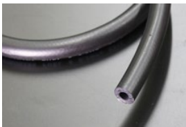
内径8mm フューエルゴムホース (キャブ車用) 本体 ¥1,000/1m