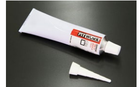
日産 シールパッキン ブラック エンジンの組み立て用に使用できる液体 ガスケットで乾燥後は耐熱、耐油に優れた ゴム状の弾性被膜を形成する 価格：¥3,100