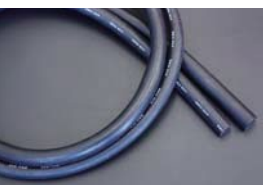
汎用ヒーターホース (肉厚 4mm 長さ 1m) ・内径 16φ ヒーターホース ¥1,700 ・内径 19φ ヒーターホース ¥2,000