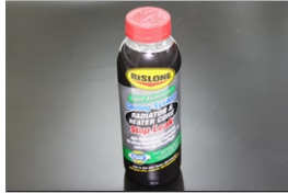
リスロン 超強力水漏れ修理剤 ラジエーター&ヒーターコアストップリーク ※ラジエーターやヒーターコアからの水漏れを 高い確率で永久的に治せる修理剤 価格：¥3,200