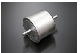
GC210/S130インジェクション フューエルフィルター (φ73) 品番：16400-Q0805 適合：L型インジェクション車 価格：¥7,940