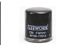
オイルフィルター 品番：AY100-TY014 適合：4AG, 3SG 価格：¥1,000