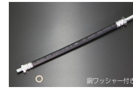
SR311/SP311 純正クラッチホース ・全長 : 275mm (ねじ部込み) ・適合 : SR311/SP311全車 ・価格 : ¥3,940