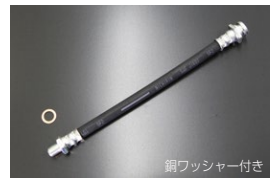
S30, S31 純正クラッチホース ・全長 : 230mm (ねじ部込み) ・適合 : S30, S31 ・価格 : ¥3,260