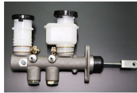
SR311 ブレーキマスターシリンダー サイズ : 3/4 適合 : SR311, SP311 (67.5~70年) 価格 : ¥39,000 ※右ハンドル車はプッシュロッドを現行品と差し替えて使用。左車はボルトオン