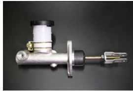
5/8クラッチマスターシリンダー 適合 : SR311, SP311 サイズ : 5/8 価格 : ¥17,000