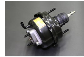
GC110前期マスターバック サイズ : 外径143φ (ツメ部) ※スペーサー使用でハコスカ流用可 価格 : ¥23,800