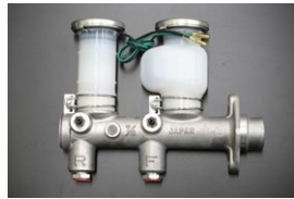
P330 ブレーキマスターシリンダー サイズ : 7/8 (日産純正ナブコ製) 適合 : リヤドラム車 (L20/L28) (75.6~79.5) 価格 : ¥49,900