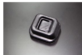
SR311クラッチフォークブーツ 適合 : SR311全車/SP311 (後期) ※5速ミッション用 価格 : ¥2,500