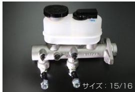
S130 ブレーキマスターシリンダー (後期 右ハンドル車用) 適合 : 81.10~83.8 (L20/L28) 価格 : ¥42,000 ※パイプの取り付け位置が標準より6cm下がります。