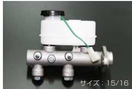
S130 ブレーキマスターシリンダー (後期 左ハンドル車用) 適合 : 81.10~83.8 (L20E) 81.10~83.8 (L28E) 価格 : ¥35,000