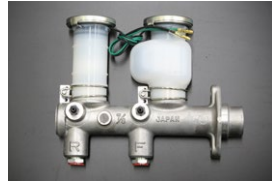
KHC130 ブレーキマスターシリンダー サイズ : 7/8 (日産純正ナブコ製) 適合 : リヤドラム車 (L20) (75.10~80.10) 価格 : ¥49,900