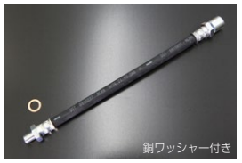
GC10, KPGC10 純正クラッチホース ・全長 : 260mm (ねじ部込み) ・適合 : GC10, KGC10, KPGC10 ・価格 : ¥2,420