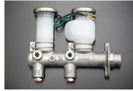
GC110 ブレーキマスターシリンダー サイズ: 7/8 (日産純正ナブコ製) 適合: GC110後期型, GC111 (リヤドラム車 75.10~77.7) 価格: ¥49,900