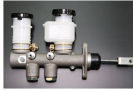
SR311 ブレーキマスターシリンダー サイズ: 3/4 適合: SR311, SP311 (67.5~70年) 価格: ¥39,000 ※右ハンドル車はプッシュロッドを現行品と差し替えて使用。左車はボルトオン