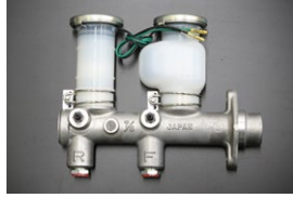
KHC130 ブレーキマスターシリンダー サイズ: 7/8 (日産純正ナブコ製) 適合: リヤドラム車 (L20) (75.10~80.10) 価格: ¥49,900