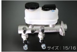
S130 ブレーキマスターシリンダー (後期 右ハンドル車用) サイズ: 15/16 適合: 81.10~83.8 (L20/L28) 価格: ¥42,000 ※パイプの取り付け位置が標準より6cm下がります。