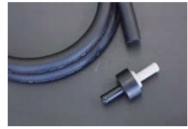
マスターバックホース&チェックバルブ ・汎用チェックバルブ ¥3,830 ・汎用マスターバックホース ¥4,520 (内径9mm×1.5M)