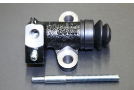
手動調整 3/4リリースシリンダー 適合: GC10/S30前期 サイズ: 3/4 価格: ¥8,410