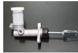
5/8クラッチマスターシリンダー 適合: GC211, GC211 (GT, GTX用) サイズ: 5/8 価格: ¥11,000