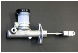
5/8クラッチマスターシリンダー (汎用タイプ) 適合: S30, GC110, C130, 510 価格: ¥12,600