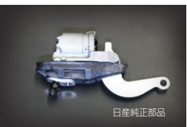
7/8大容量ホイールシリンダー 適合: GC10, GC110, 510 価格: ¥22,900/1ヶ ¥26,500/1ヶ