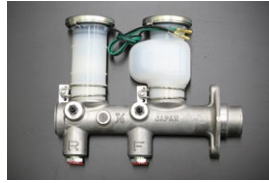
P330 ブレーキマスターシリンダー サイズ: 7/8 (日産純正ナブコ製) 適合: リヤドラム車 (L20/L28) (75.6~79.5) 価格: ¥49,900