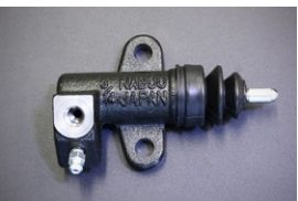
L型3/4リリースシリンダー Assy 品番: 30620-U7001 サイズ: 3/4 適合: L型全車 (自動調整タイプ) 価格: ¥5,030