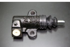
FJ20 標準リリースシリンダー 適合: FJ20全車 サイズ: 3/4 (自動調整) 価格: ¥5,880