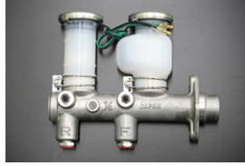
KHC130 ブレーキマスターシリンダー サイズ: 7/8 (日産純正ナブコ製) 適合: リヤドラム車 (L20) (75.10~80.10) 価格: ¥49,900