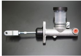
5/8クラッチマスターシリンダー 適合: GC10, KGC10 (GT, GTX用) サイズ: 5/8 ※クレビスは純正に交換必要 価格: ¥15,000