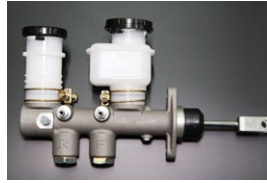
SR311 ブレーキマスターシリンダー サイズ: 3/4 適合: SR311, SP311 (67.5~70年) 価格: ¥39,000 ※右ハンドル車はプッシュロッドを現行品と差し替えて使用。左車はボルトオン