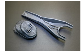
L型クラッチフォーク&ブーツ SET ・肉厚が1mm厚ククラックに強い強化タイプ 適合: L型全車 (自動調整タイプ) 価格: ¥4,500