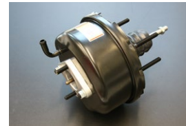
GC110 後期マスターバック 後期用ビックサイズです。(162φ) 前期に付ければ制動力アップ。 ¥48,700 ※ボディ加工とスペーサーでGC10取付可