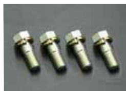
MK63 キャリパー取り付けボルト

適合：S30,GC10,GC110,230 KHC130 価格： ¥420 /1ヶ ¥460