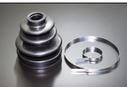
等速ドライブシャフトブーツ (内側)

適合：S30,S130,GC10,GC110 GC210,KHC130他 価格： ¥2,100 /1ヶ ※バンド付き片側セット