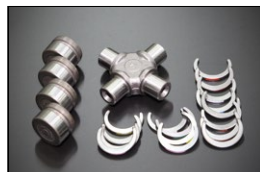
フロベラシャフトスパイダーSET

適合：S30,S130,GC10,GC110 GC210,KHC130他 価格：8本セット¥9,200 単品：ボルト¥1,010 ナット¥100 ワッシャー¥40