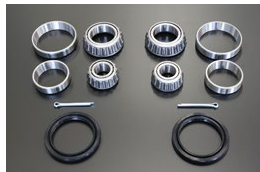
フロントハブベアリング オーバーホールキット

適合：GC10/GC110/GC210 S30/S130 価格： ¥13,580 /左右セット