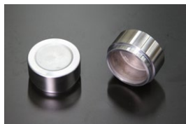
純正キャリパーピストン

適合：MK63 (NISMO,プレジデント) 価格： ¥2,110 /1ヶ ¥2,220/1ヶ