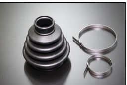
ドライブシャフトブーツSET

適合：S30,S130,GC10,GC110 GC210,KHC130他 価格：¥8,560/1ヶ