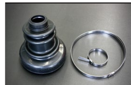
等速ドライブシャフトブーツ (外側)

品番：39740-04F25 相当品 適合：S130、R30 (ターボ車) 価格：¥2,200/1ヶ ※ハウジングを分解せずに交換するタイプ