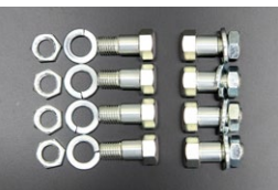
ドライブシャフトボルトSET

適合：S30,S130,GC10,GC110 GC210,KHC130他 価格：8本セット¥9,200 単品：ボルト¥1,010 ナット¥100 ワッシャー¥40