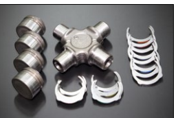
ドライブシャフトスパイダーSET

適合：S30,S130,GC10,GC110 GC210,KHC130他 価格：¥6,120/1ヶ