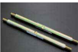
S30 リヤロアアームスピンドル ¥2,490/1本 ¥1,850 /1本

品番：39741-04F25 相当品 適合：S130、R30 (ターボ車) 価格：¥2,000/1ヶ