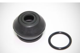
ボールジョイントブーツSET

・ロアアームブッシュの交換時に 固着したスピンドルを交換 ※別売り ロックボルト ¥1,360/1本