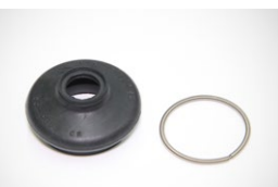
タイロッドエンドブーツSET

適合：GC10 価格：¥760/1個セット ※単品 ブーツ¥540 バンド¥220