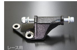
L6 貫通式オルタネーターブラケット ※チューニングカーのボルト緩み対策品。 クロモリ強化ボルト(M10×130) 付属 ※取付…オルタネーター穴拡大加工必要 価格： ¥7,100