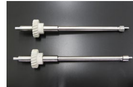
L6 スピンドルギヤ 後期型：KAMEARI製品 写真上 価格： ¥15,000 前期型：日産純正部品 写真下 価格： ¥10,000