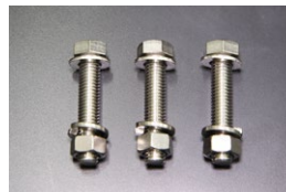
L6 タコ足 メガネフランジボルトSET (材質：ステンレスSUS304) ※M8×40 マフラー取付ボルト 価格： ¥1,200/SET