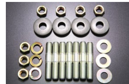
L4 エキマニ取付ボルトセット ※純正スタッドボルトやヨーク、ナット ワッシャーをキットにした標準セット。 L4 SET 価格： ¥2,010