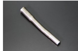
L6 オイルレベルゲージガイド 価格： ¥460