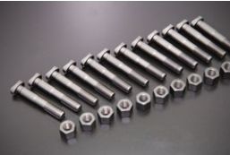
L型 純正コンロッドボルト&ナットSET 原動機：L20,L24,L28,L14,L16,L18 適合：9mmサイズのL型全車 価格：L6 ¥7,200 L4 ¥4,800