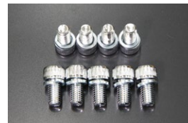
クラッチカバー強化ボルト9本SET (縮付トルク：4.0kg/m 39.2N・m) 適合：L6(240mm) 亀有大径クラッチ FJ20ET, SR20, RB20 価格： ¥2,250 ※腐食に強いクロムメッキ仕上げ