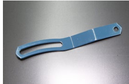
L6オルタネーターアジャストスレー 適合：L20,L24,L26,L28 価格： ¥460