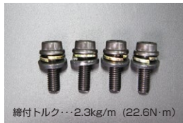
L型 チェーンガイド強化ボルトSET ※強化クロモリフランジボルト (M6×18) スプリングワッシャー M6×φ14×t2.3平ワッシャー 価格： ¥800/SET