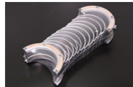
L6 純正0.25アンダーメインメタルSET 原動機：L20,L24,L28 適合：ジャーナルが0.25アンダーで スラストがSTDタイプ 価格： ¥15,700