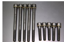
L6 カムホルダー強化ボルトSET ※多少長めの設定でネジ山を痛めづらい M8×100 縮付：2.5kg/m(24.5N・m) M8×40 縮付：2.2kg/m(21.5N・m) 価格： ¥2,250