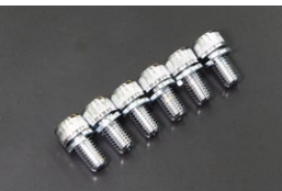
クラッチカバー強化ボルト6本SET (縮付トルク：4.0kg/m 39.2N・m) 適合：L6(225mm) ,L18, FJ20(NA) L20B, A型, 2TG, 18RG, 4K 価格： ¥1,500 ※腐食に強いクロムメッキ仕上げ