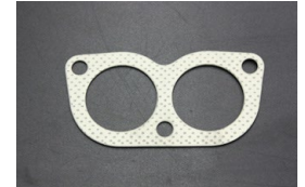
STDメガネマフラーガasket 適合：GC10/S30前期 ※純正エキゾースト用 価格： ¥800