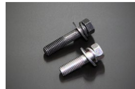
L6 スターターボルトSET 価格： ¥440/SET