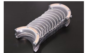
L6 純正0.5アンダーメインメタルSET 原動機：L20,L24,L28 適合：ジャーナルが0.5アンダーで スラストがSTDタイプ 価格： ¥15,700