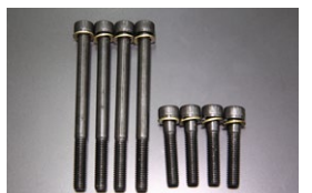
L4 カムホルダー強化ボルトSET ※多少長めの設定でネジ山を痛めづらい M8×100 縮付：2.5kg/m(24.5N・m) M8×40 縮付：2.2kg/m(21.5N・m) 価格： ¥1,800