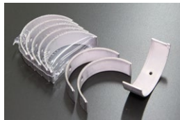
VG30DETコンロッドメタル 適合：L32幅狭コンロッド用 グレード：#0 #1 #2 価格： ¥2,040 /1枚