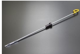
S130 オイルレベルゲージ ※上部からHまでの距離179mm HからLまで19mm 価格： ¥670