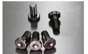
L4 ARP強化フライホイールボルト ※チューニングカーのボルト緩み対策品。 縮付トルク…18.5kg/m (181.4 N・m) 価格： ¥10,000