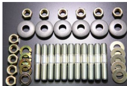
L6 エキマニ取付ボルトセット ※純正スタッドボルトやヨーク、ナット ワッシャーをキットにした標準セット。 L6 SET 価格： ¥3,130