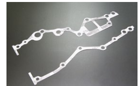
L20B フロントカバーG/K ※左右セット 価格： ¥1,340/SET