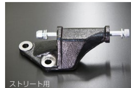
L6 貫通式オルタネーターブラケット ※チューニングカーのボルト緩み対策品。 クロモリ強化ボルト(M8×130) 付属 ※取付…ボルトオン 価格： ¥6,400