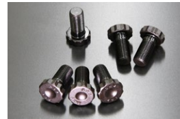
L6 ARP強化フライホイールボルト ※チューニングカーのボルト緩み対策品。 縮付トルク…18.5kg/m (181.4 N・m) 価格： ¥12,000