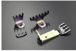
L6 プラグコードホルダーセット (スタンダード) 適合：支柱は2本ボルトサーマカバー用 価格： ¥8,000/set