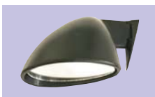
汎用ドアミラー (左右set) 1set ¥24,000 (ミラー径×横×長さ×張出し) 92×144×101×148