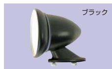
汎用フェンダーミラー (左右set) 1set ¥20,000 (ミラー径×全長×高さ) φ103×125×110