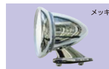
汎用フェンダーミラー (左右set) 1set ¥24,000 (ミラー径×全長×高さ) φ103×125×110