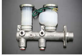
KHC130 ブレーキマスターシリンダー サイズ: 7/8 (日産純正ナブコ製) 適合: リヤドラム車 (L20) (75.10~80.10) 価格: ¥39,900