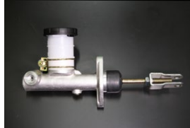
5/8クラッチマスターシリンダー 適合: SR311 SP311 サイズ: 5/8 価格: ¥17,000