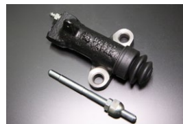
SR311標準リリースシリンダー 適合: SR311全車/SP311 (後期) サイズ: 3/4 (手動調整) 価格: ¥9,490