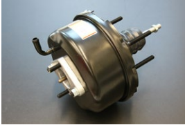
GC110 後期マスターバック 後期用ビックサイズです。(162φ) 前期に付ければ制動力アップ。 ¥44,300 ※ボディー加工とスペーサーでGC10取付可