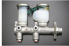
P330 ブレーキマスターシリンダー サイズ: 7/8 (日産純正ナブコ製) 適合: リヤドラム車 (L20/L28) (75.6~79.5) 価格: ¥39,900