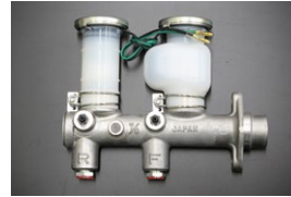
GC110 ブレーキマスターシリンダー サイズ: 7/8 (日産純正ナブコ製) 適合: GC110後期型, GC111 (リヤドラム車 75.10~77.7) 価格: ¥39,900