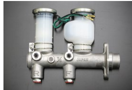
GC210 ブレーキマスターシリンダー サイズ: 7/8 (日産純正ナブコ製) 適合: リヤドラム車 (L20E) (77.8~81.7) 価格: ¥39,900