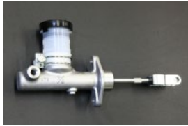
5/8クラッチマスターシリンダー (汎用タイプ) 適合: S30, GC110, C130 価格: ¥12,600