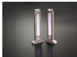
内部カットモデル

リフター軸部とヘッド部の独立した2つの原子同士を、圧接という手法で金属融合レーザー一体化させました。カムシャフトの当たり面はバフ仕上げで面粗度を向上させ、その後リン酸マンガン皮膜処理を施工。油膜保持性を高め耐摩耗性を強化しました。